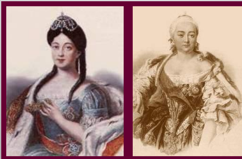
Анна и Елизавета Дочери Петра I