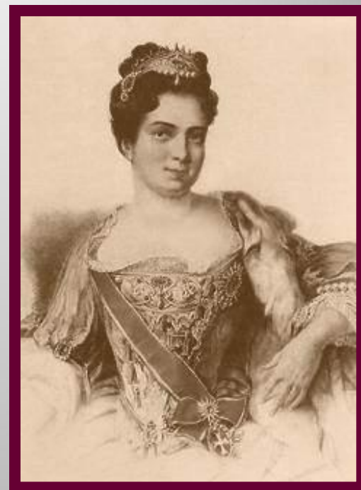
Екатерина (жена Петра)