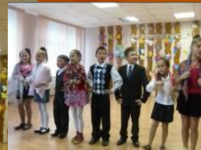
День пожилого человека