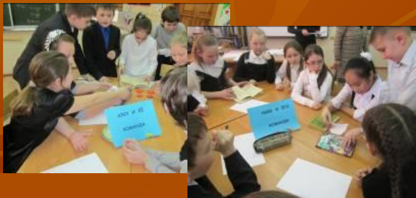
КВН «Тимур и его команда»