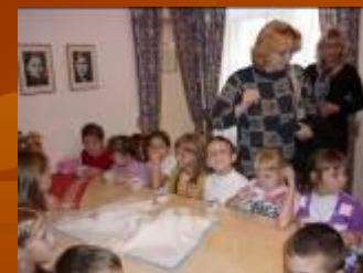
Музей М. Джалиля