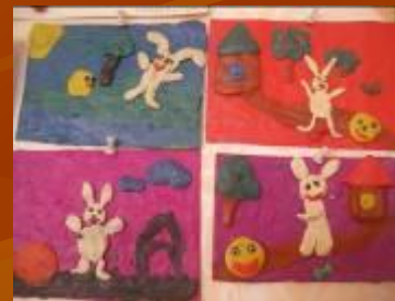
Картинка из пластилина