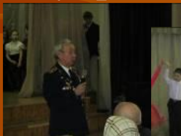
Встреча с ветеранами