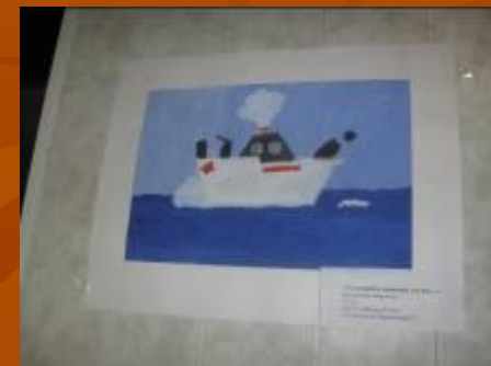
Районный конкурс рисунков «23 февраля»