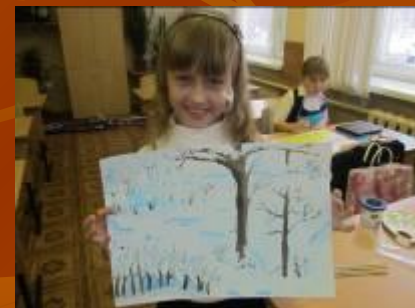
Районный конкурс юных художников