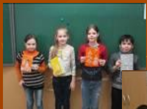
Поделки своими руками