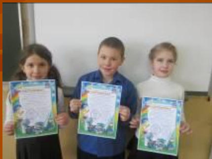
Всемирный конкурс наук