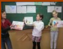
Конкурс «Необычное животное»