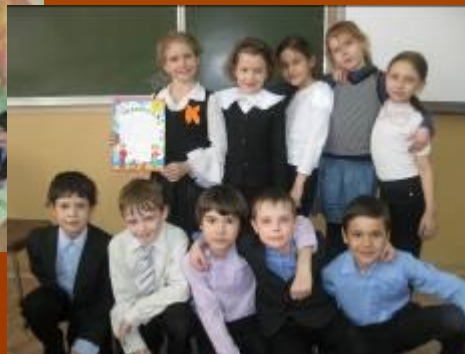
КВН по сказкам К.Чуковского