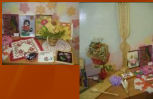
Мастера и мастерицы