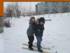
Игры на улице