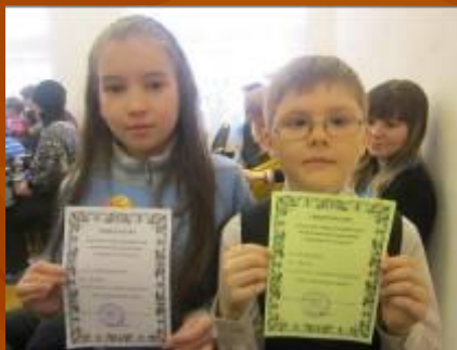
Городской конкурс «Зилантенок»