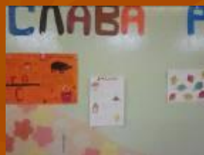
Неделя русского языка