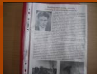
Мой родственник в годы Великой Отечественной войны