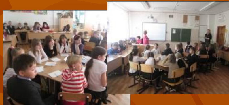
КВН «Путешествие Нильса с дикими гусями»