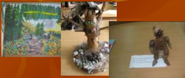
Республиканский конкурс «Лес- наше богатство»