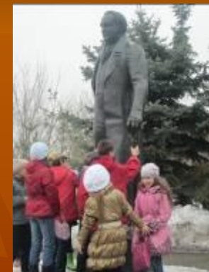
Экскурсия по городу