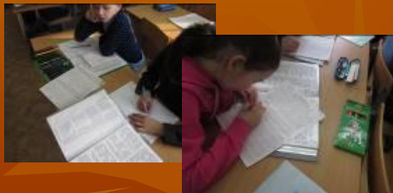
Чтение с интересом