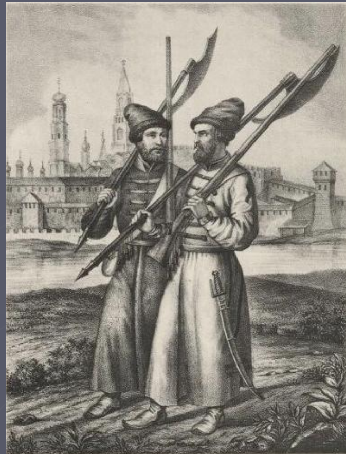
СТРЕЛЬЦЫ Московския и Семёновския полковъ. Лутохина и Илова Писавъ: въ 1674 году.