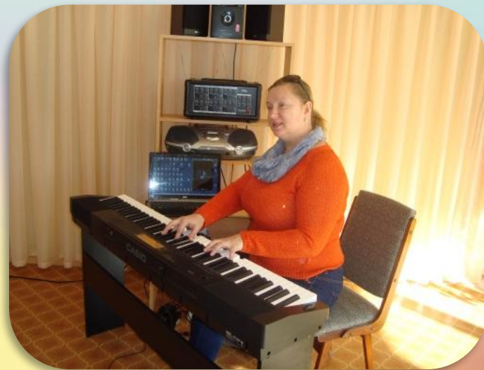
Рис. Применение ИКТ в различных видах деятельности.

Компьютерная технология формирует информационную культуру у детей, делает образовательную деятельность более наглядной и интенсивной, активизирует познавательный интерес, реализовывает личностно-ориентированный и дифференцированный подходы в обучении татарскому и русскому языкам.