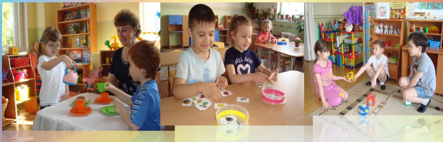
Рис. Применение игровых, проблемных, коммуникативных технологий

Строя взаимодействия в совместно - разделенной действительности и в общении с другими детьми у него развивается коммуникативная речь.