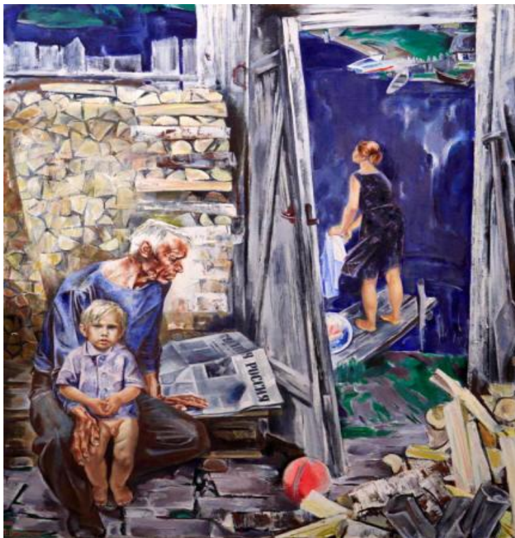
Посреди России 1983год