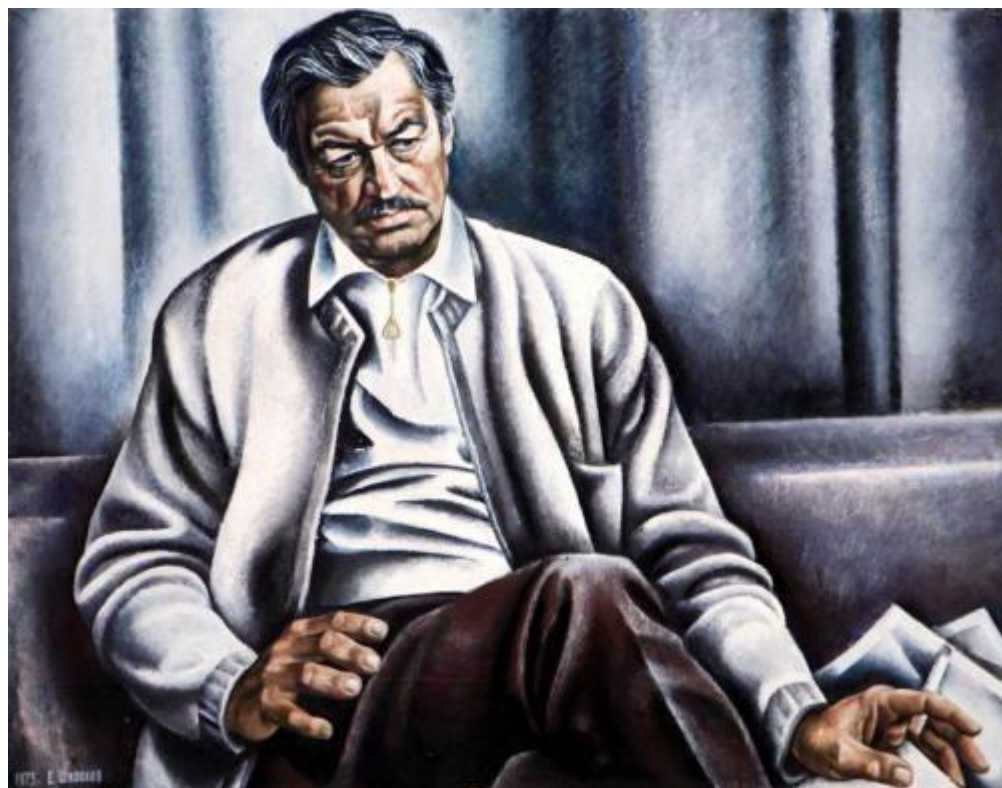
Портрет актера Е. Капеляна 1973 год