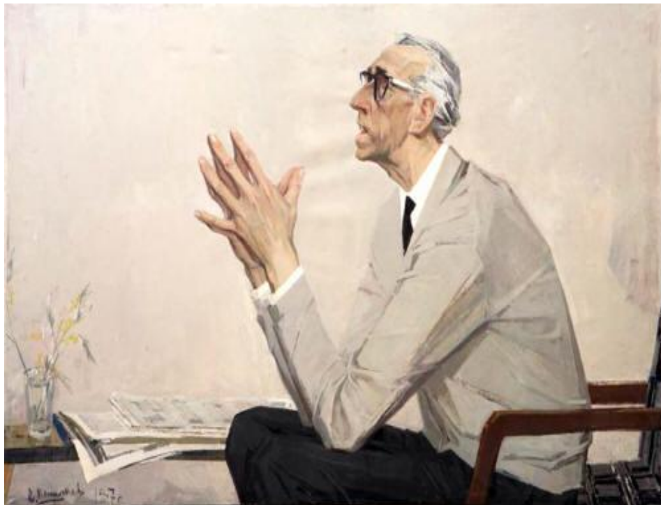
Портрет Д. Кабалевского 1971год