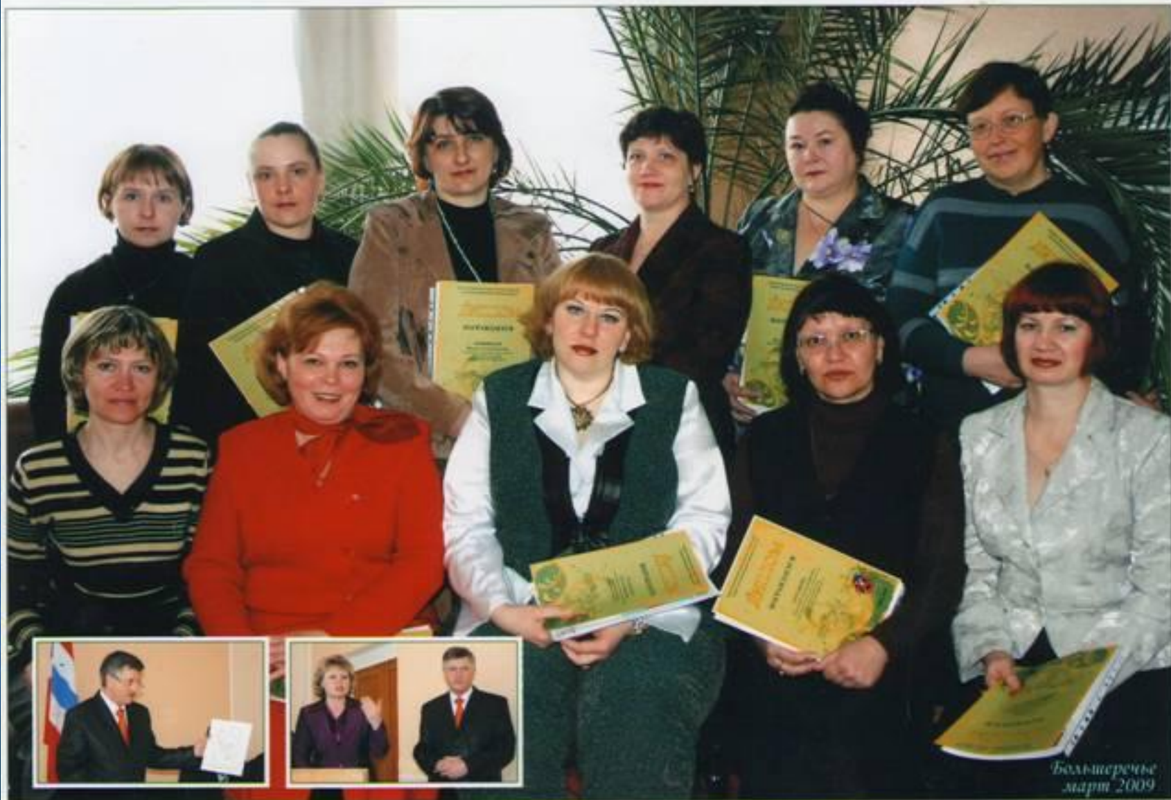
Большеречье март 2009