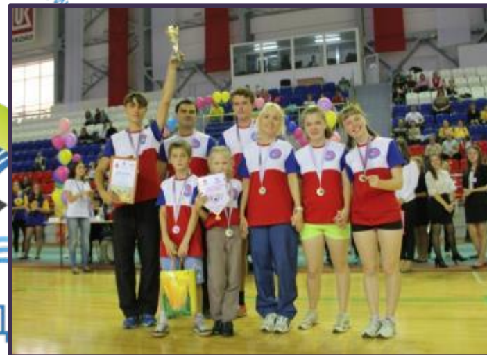
Спортивный праздник 1 октября