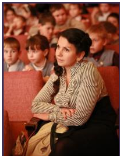
Семинар активных педагогов 30 августа