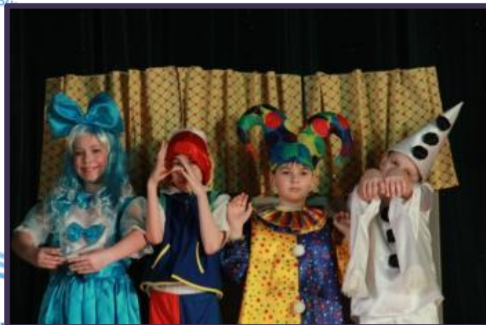
Фестиваль театров 15 марта