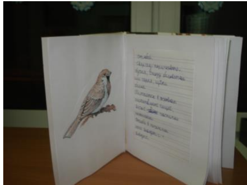
Проект «Зимующие птицы школьного двора»