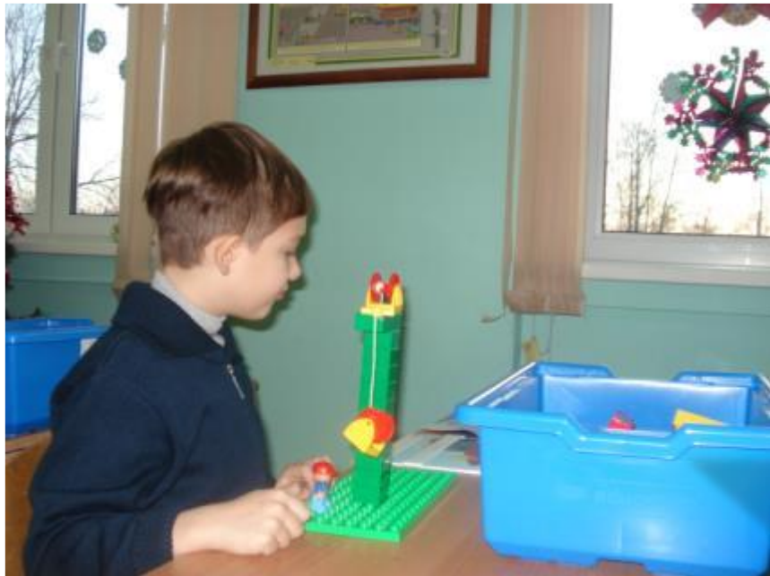
Проект «Создание и исследование игрушки-балансира и игрушки-вертушки»