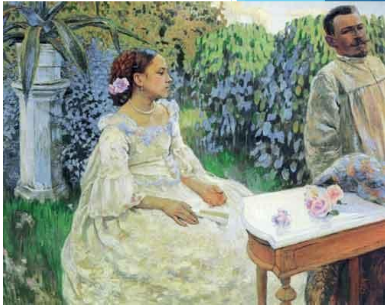
Автопортрет с сестрой, 1898 год