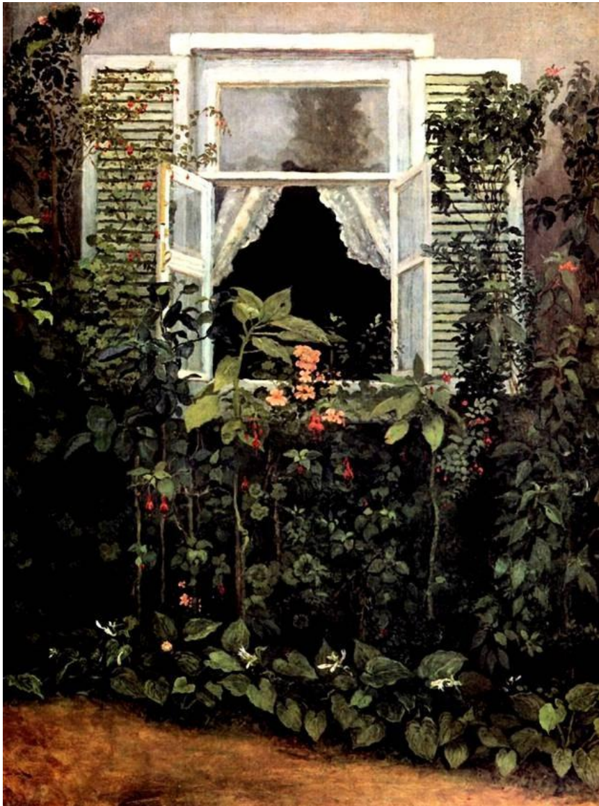
Окно, 1886 год