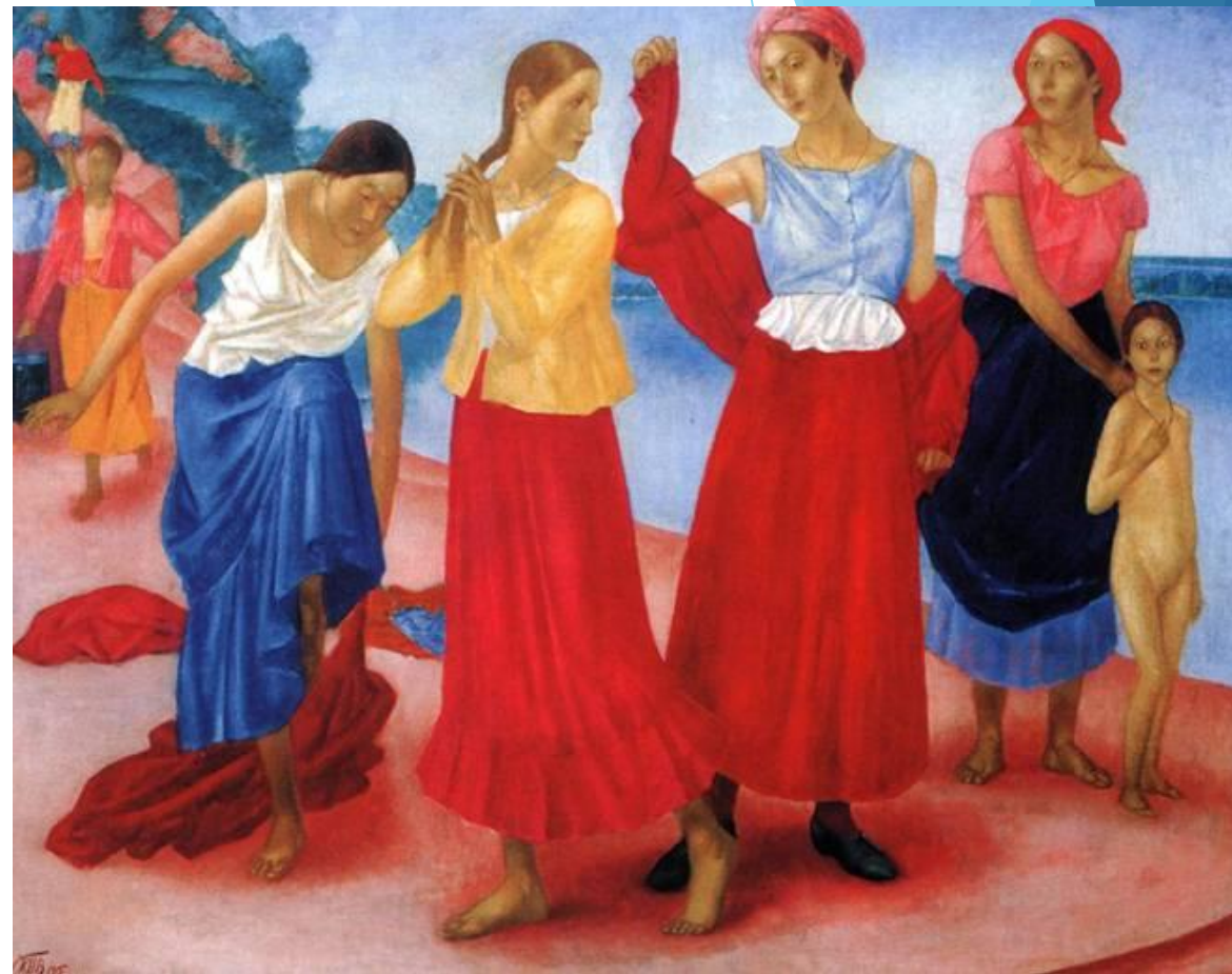
Девушки на Волге