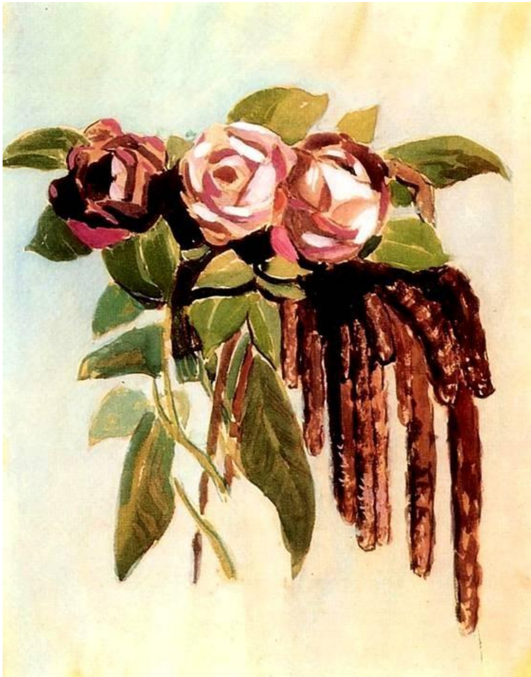
Розы и сережки, 1903 год