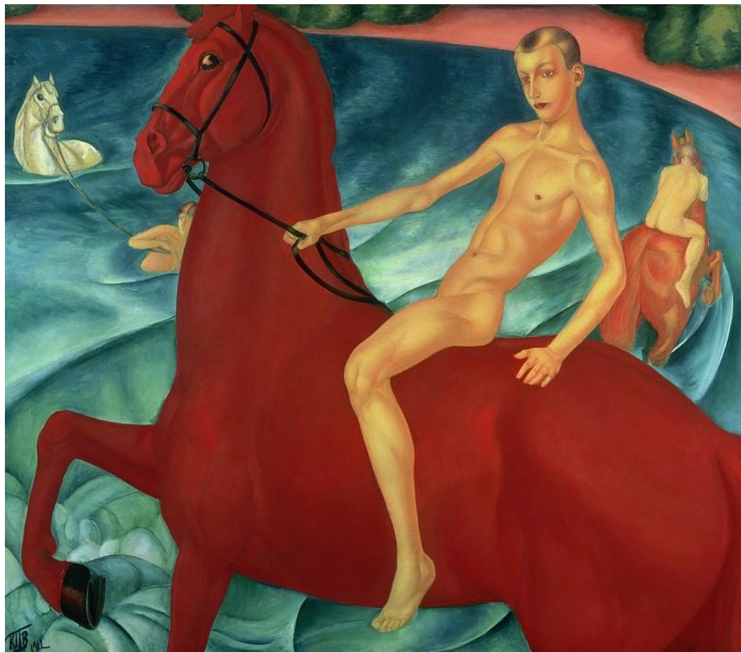
Купание красного коня