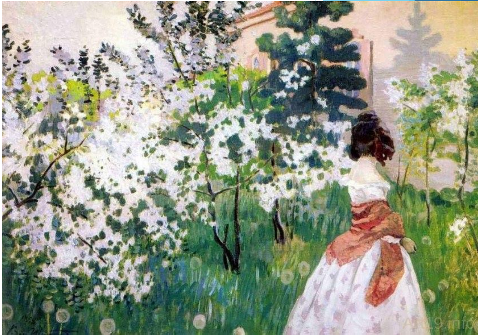
Весна, 1901 год