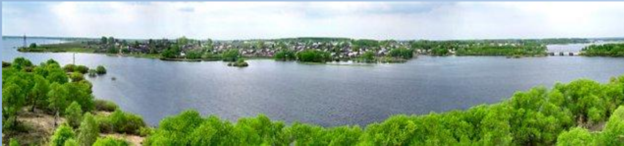
Молога – левый приток Волги