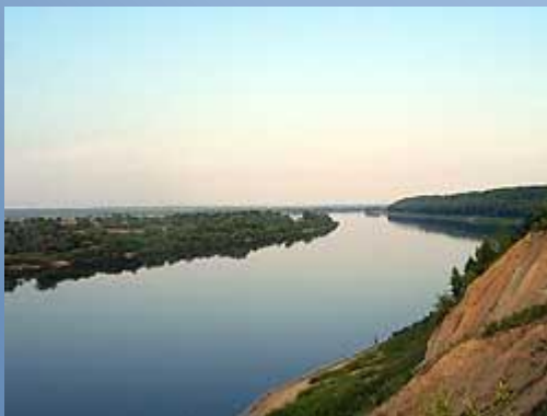
Ока – правый приток Волги