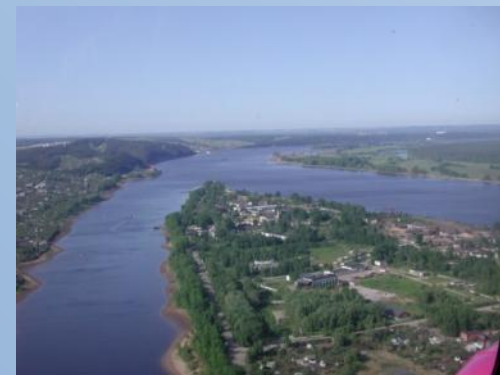
Место слияния Волги и Камы