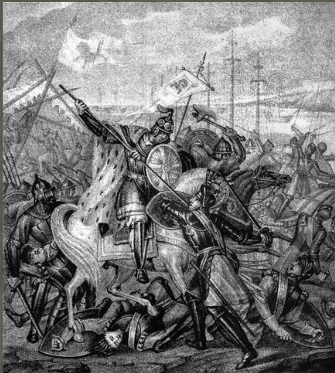
Б. Чориков. «Победа Александра Невского над шведами»