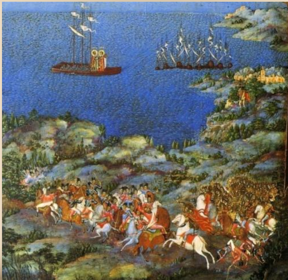
Невская битва (фрагмент иконы «Александр Невский со сценами жития», XIX век)