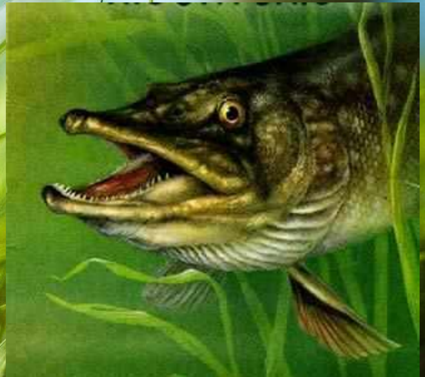
щ у к а