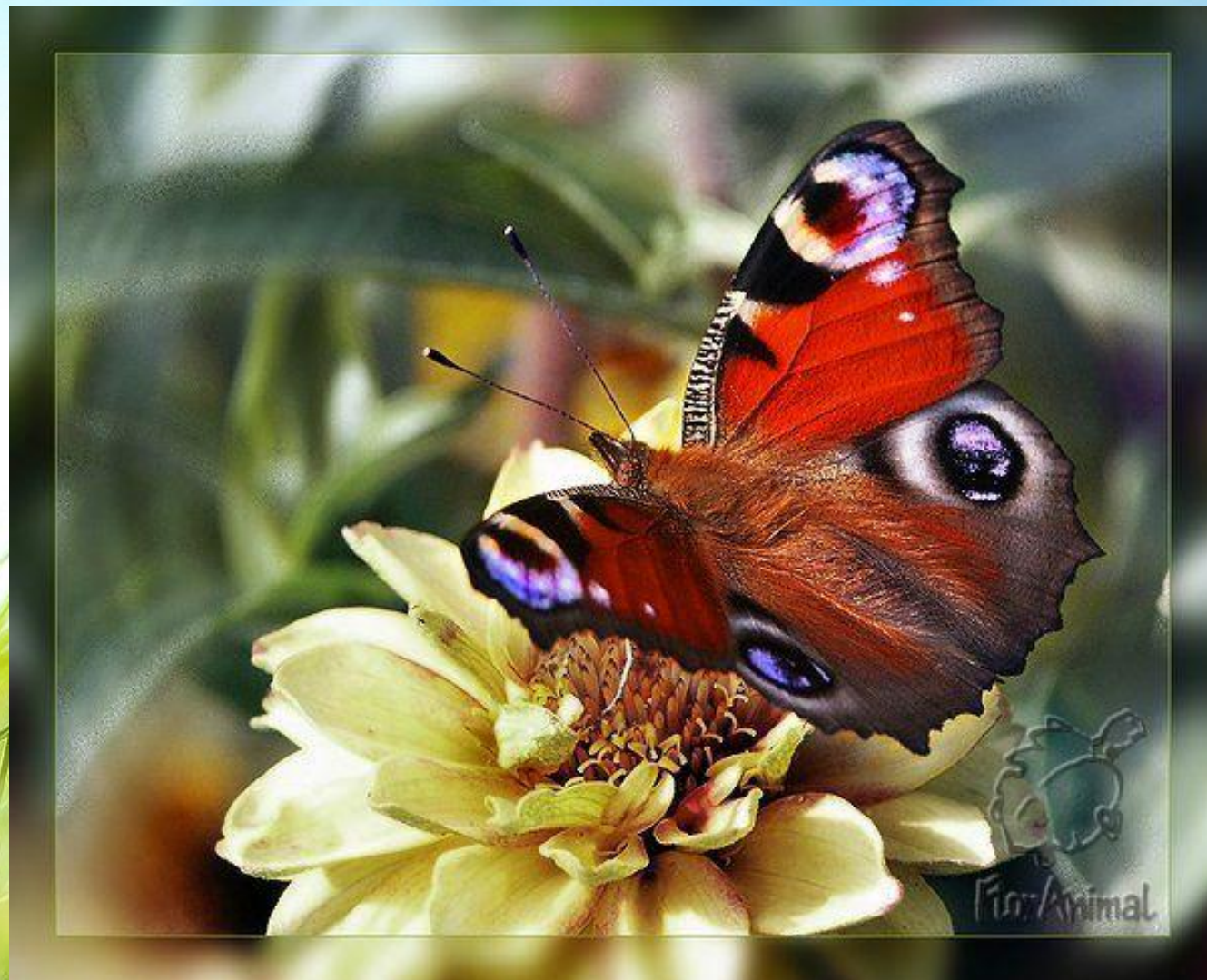
Бабочка павлиний глаз