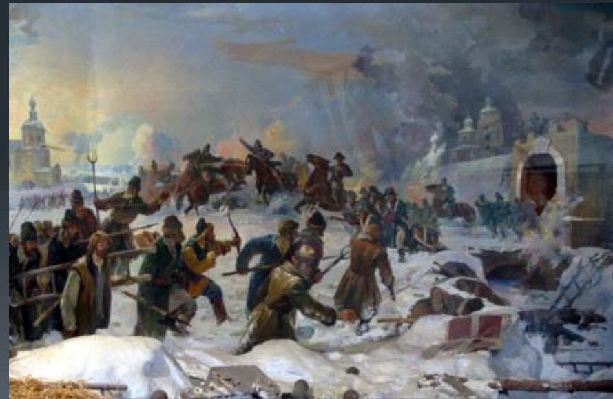
«Пугачевцы под стенами Оренбурга»