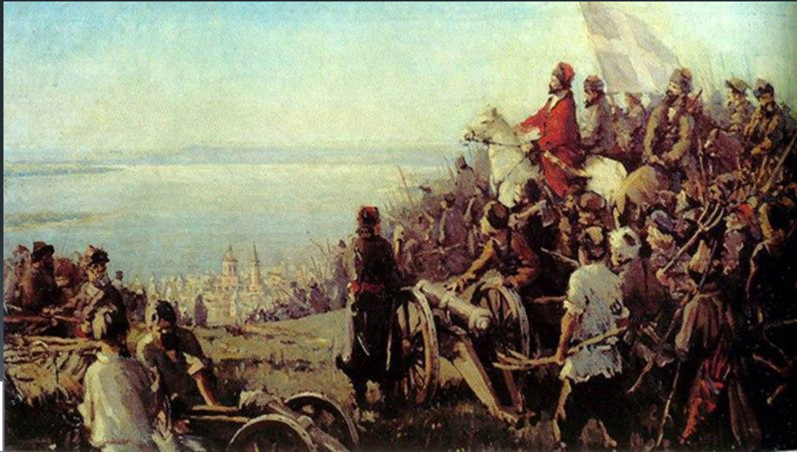
«Пугачев на Соколовой горе», В. Фомичев

Снята осада Оренбурга; июль 1774 г. – взяты окраины Казани.