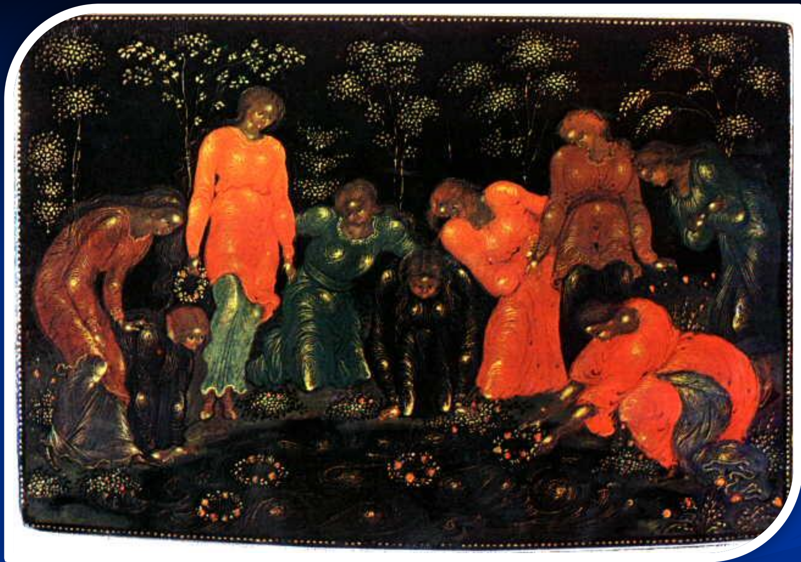
Гадание на венках