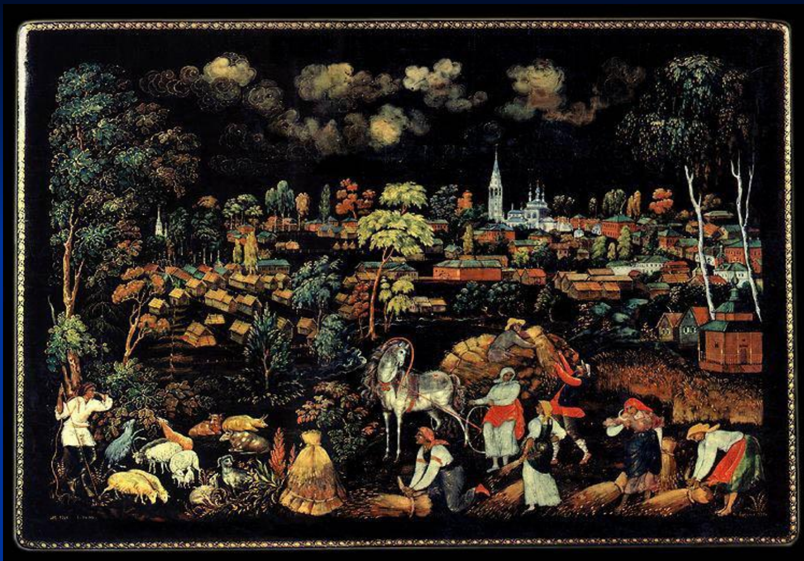
Поселок Палех. Шкатулка 1934г.