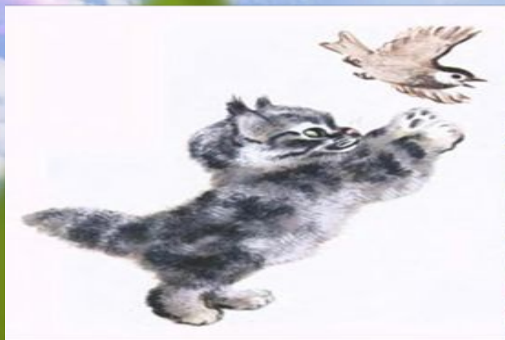
Рис. Евгений Иванович Чарушин