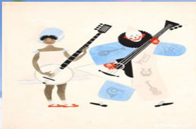
Рис. Владимир Васильевич Лебедев