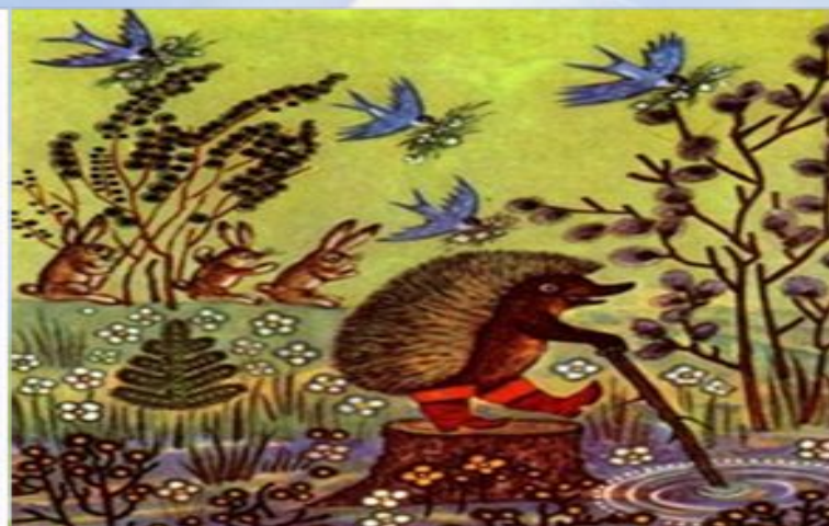
Рис. Юрий Алексеевич Васнецов