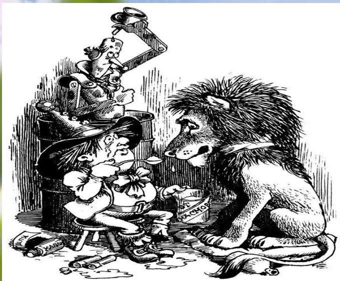
ИЛЛЮСТРАЦИЯ (от лат. - освещение, наглядное изображение) – объяснение, истолкование с помощью наглядных примеров или образцов. И обычно называется изображение служащее наглядным пояснением или дополнением какому-либо тексту. Иллюстрация литературных произведений, раскрывающая их содержание в художественных зрительных образах, является важным самостоятельным видом, изобразительного искусства. Иллюстрация органически входит в общее художественное оформление книги, журнала газеты, наряду с декоративными элементами (заставка, концовка, инициалы).