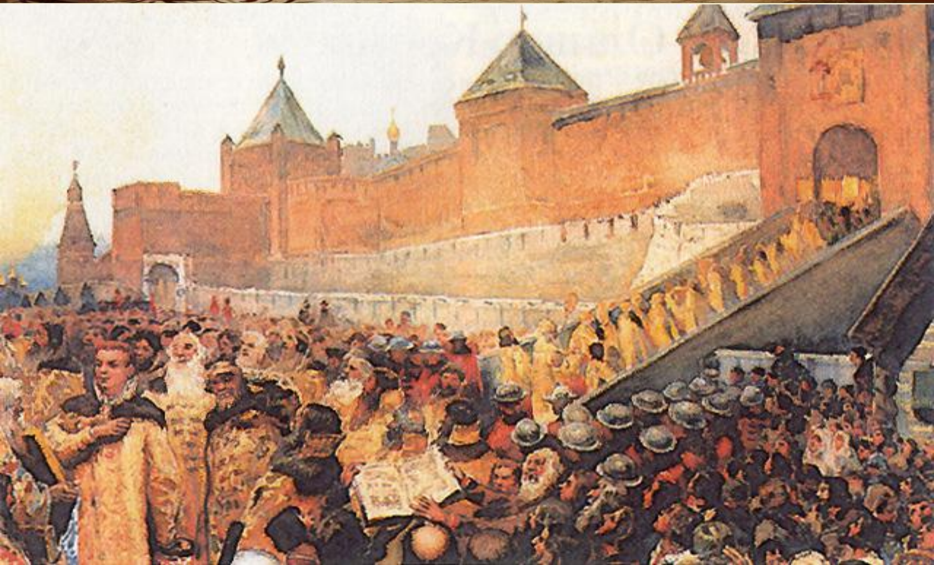
К.Лебедев. "Вступление Лжедмитрия I в Москву".