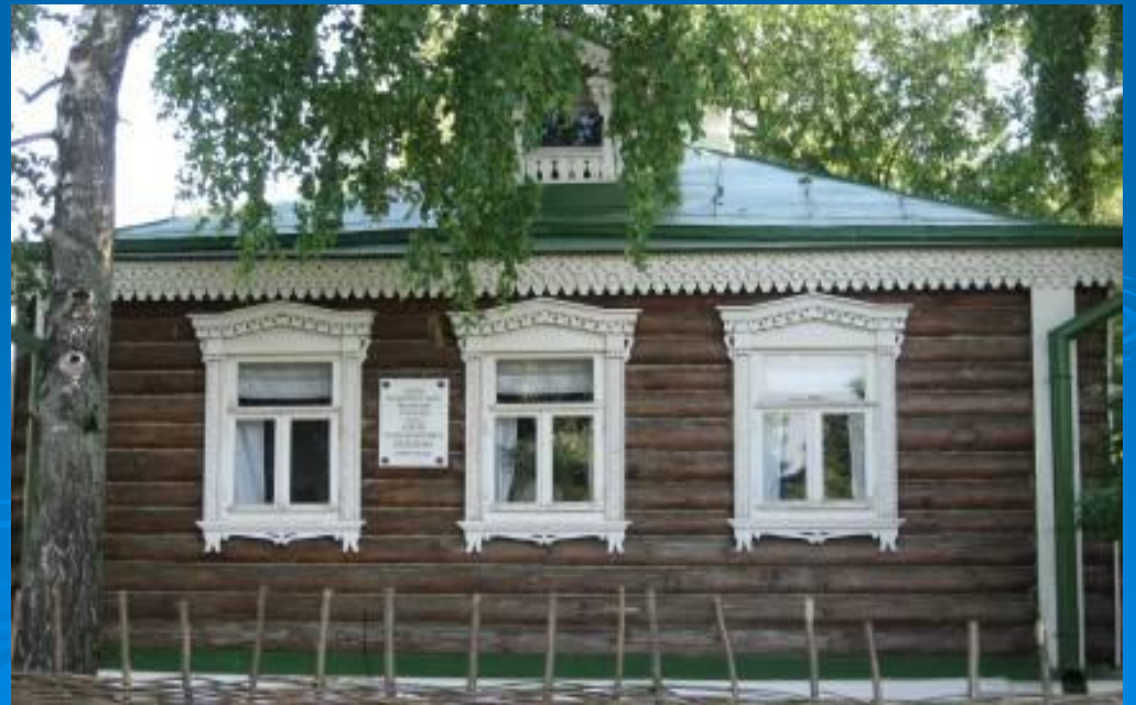
Дом родителей Есенина