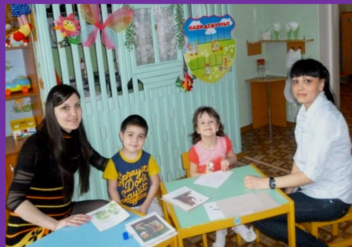
Консультация «Знаете ли вы своего ребенка?»