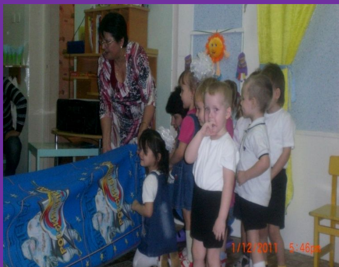
Спортивные досуг «Веселые старты» 2011