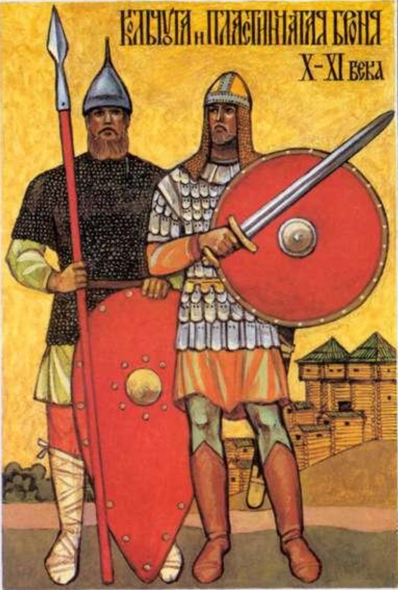
Клычуга и пластинчатая броня X-XI века