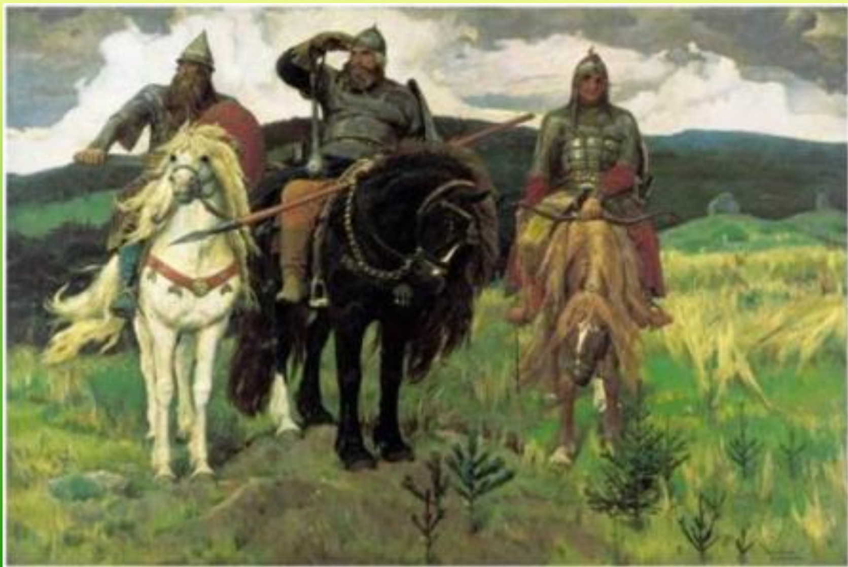
В. Васнецов. Богатыри