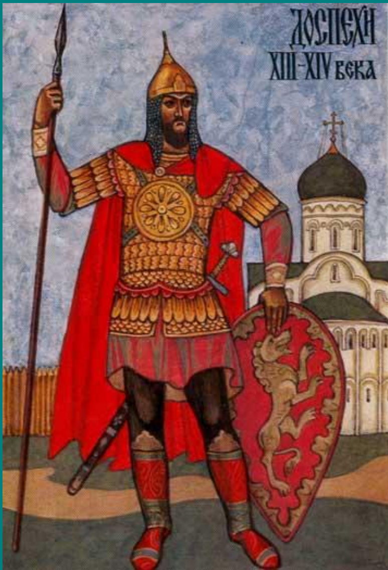
В. Семёнов. Русские доспехи