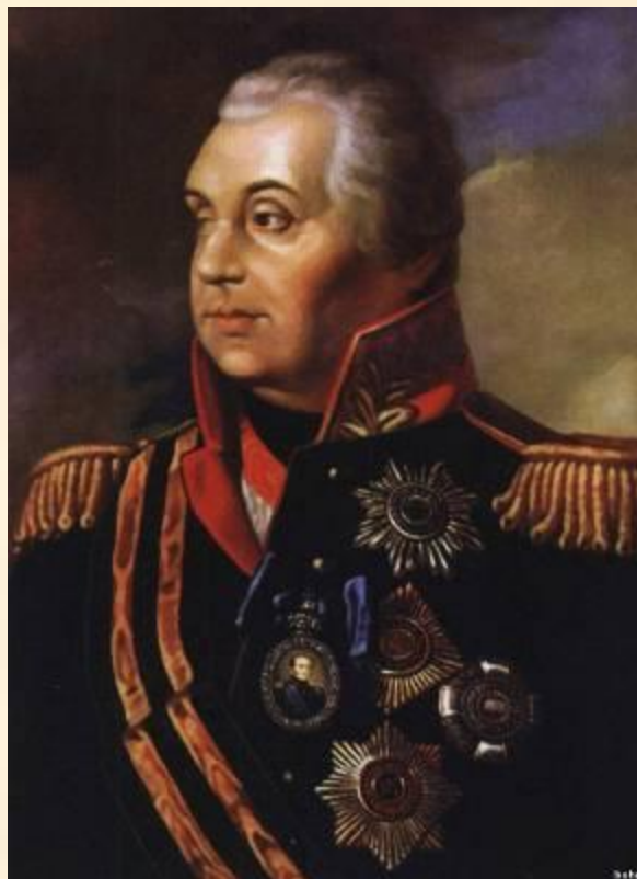
Кутузов Михаил Илларионович