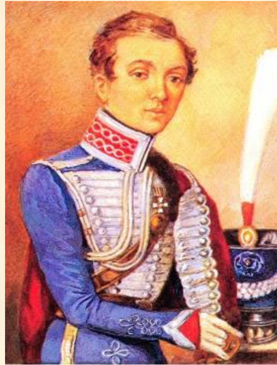
Дурова Надежда Андреевна