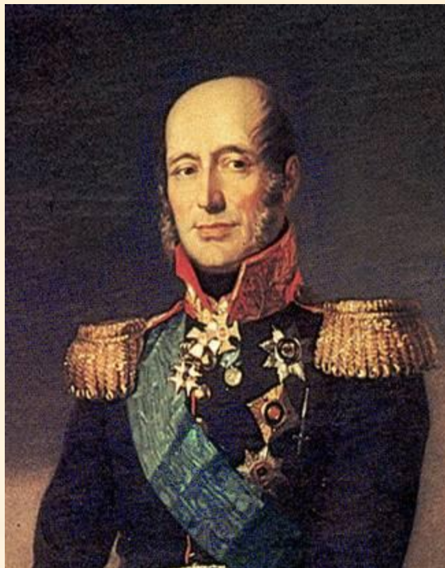
Барклай-де-Толли Михаил Богданович