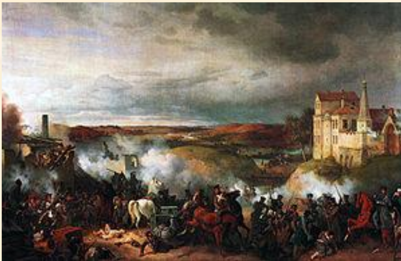
Сражение под Малоярославцем