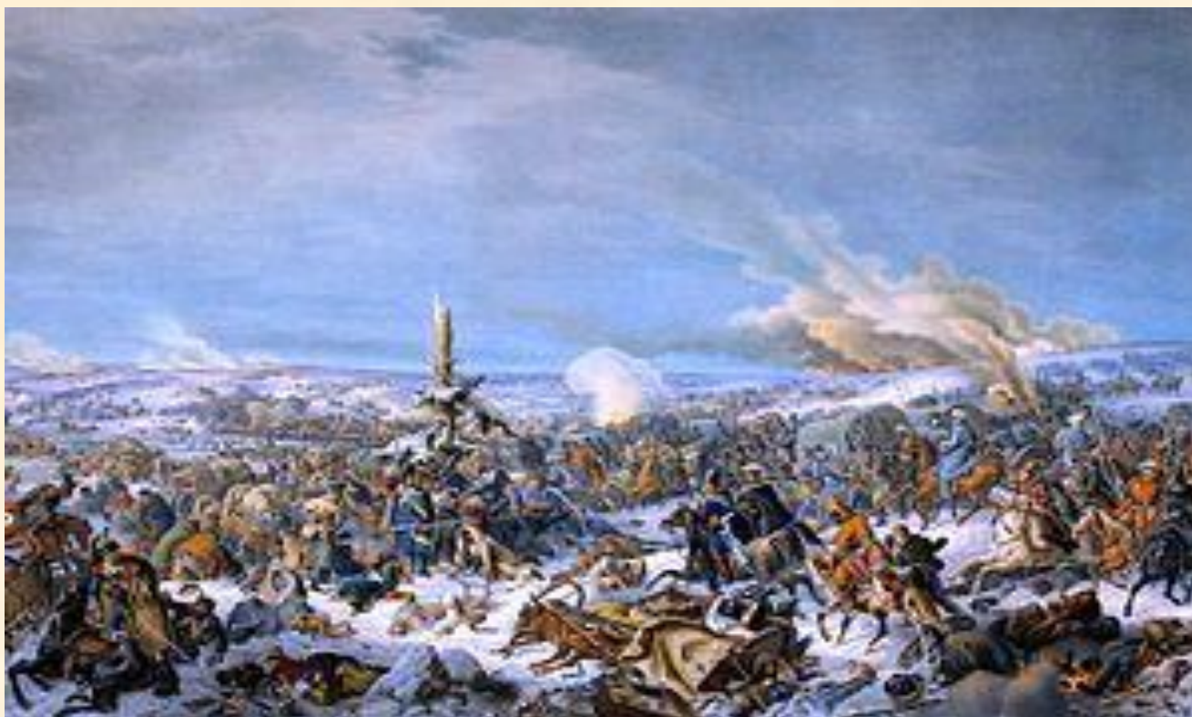
Сражение на Березине