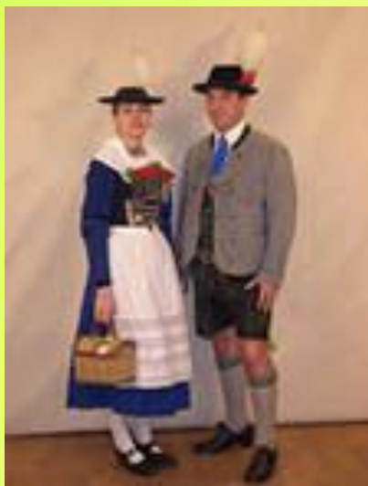
БАВАР МИЛЛИ КИЕМЕ