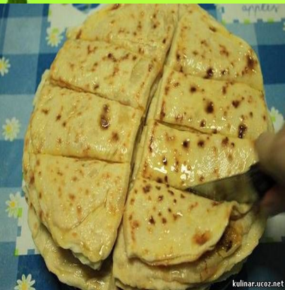
КЫСТЫБЫЙ - ТАТАР МИЛЛИ АШЫ