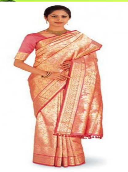
ИНДИЯ МИЛЛИ КИЕМЕ