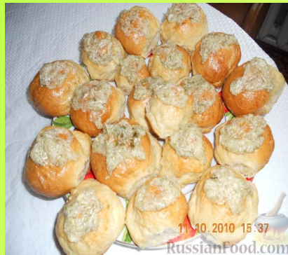
ПАМПУШКИ - УКРАИН МИЛЛИ АШЫ