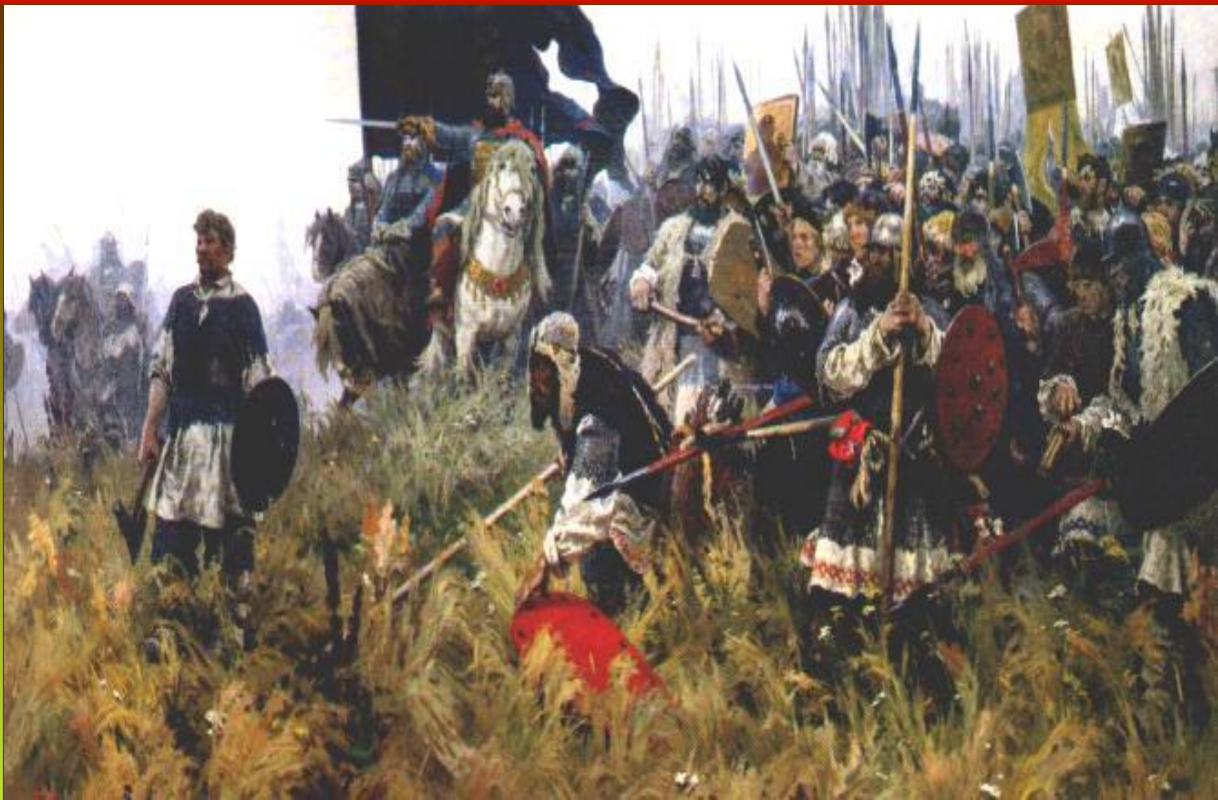
А.П.Бубнов " Утро на Куликовом поле". 1947 г. ГТГ