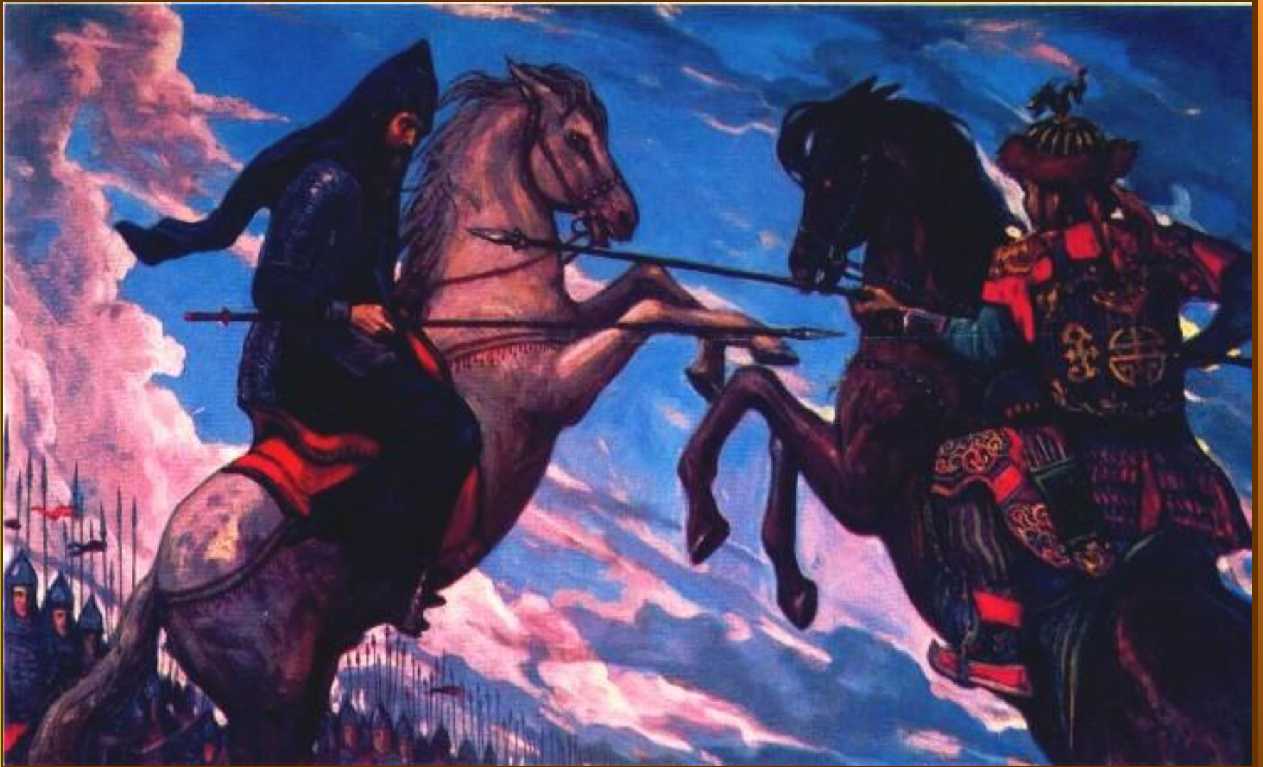
И.Глазунов. Поединок Пересвета с татарским богатырем Темир-Мурзой (Челубеем)