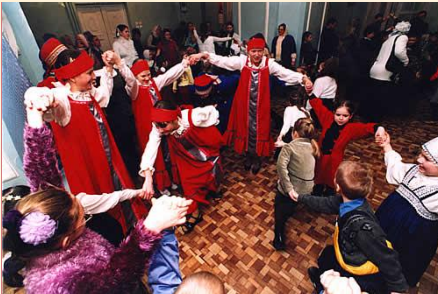
Игровой хоровод с «заплетением плетня»