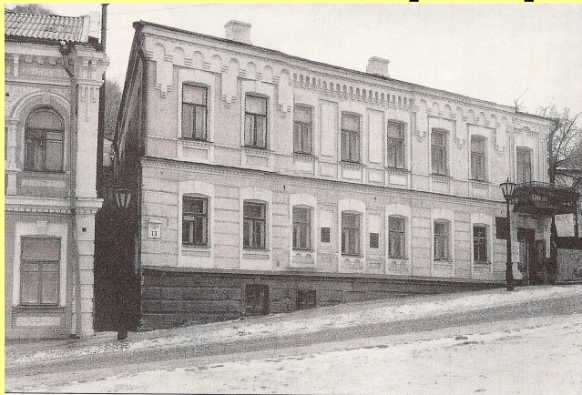
Дом по Андреевскому спуску, 13, где Булгаковы жили в 1906–1919 гг.