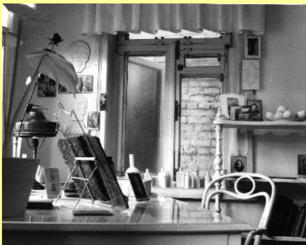
Комната Михаила Булгакова