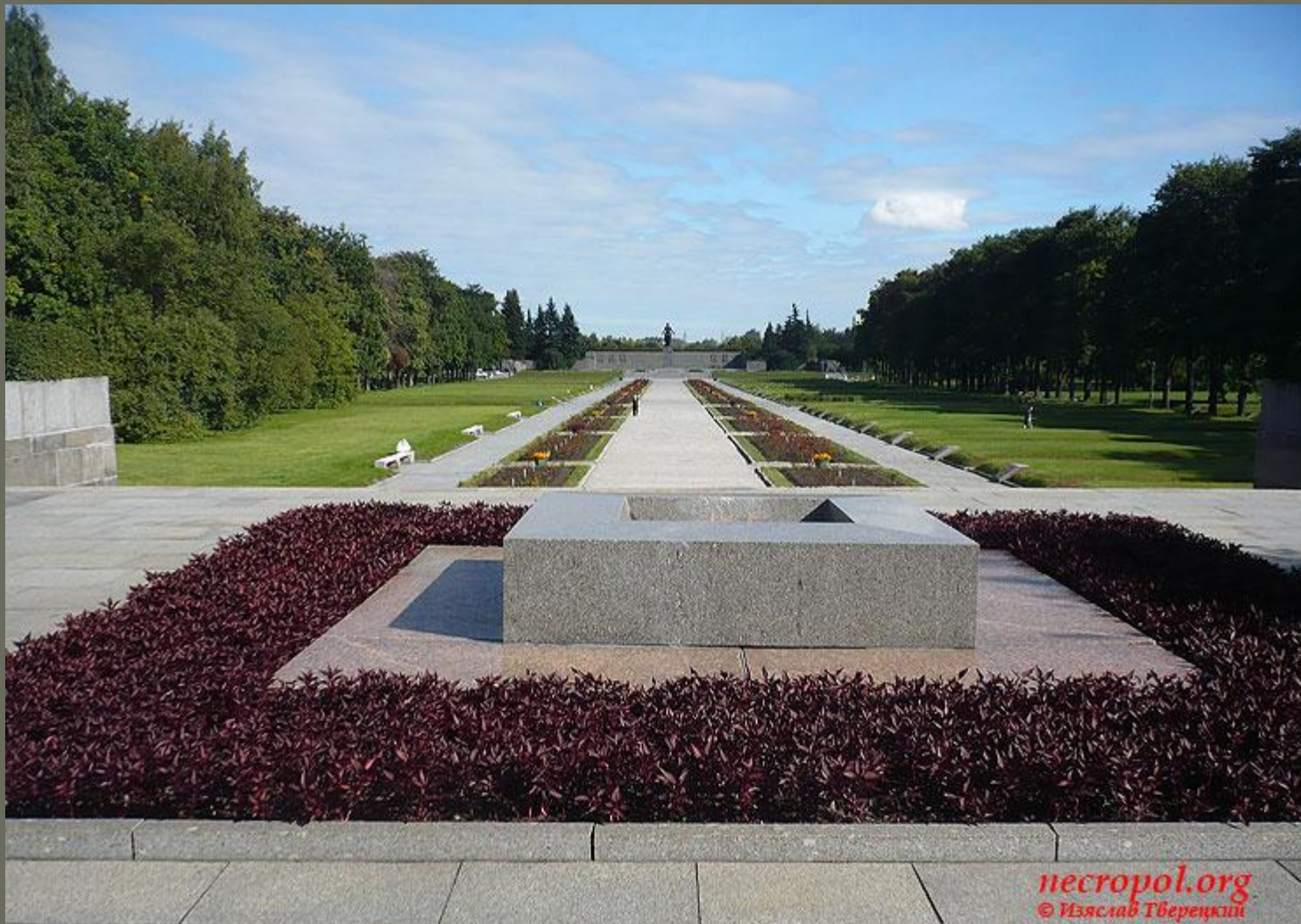
Пискаревское мемориальное кладбище, Санкт-Петербург