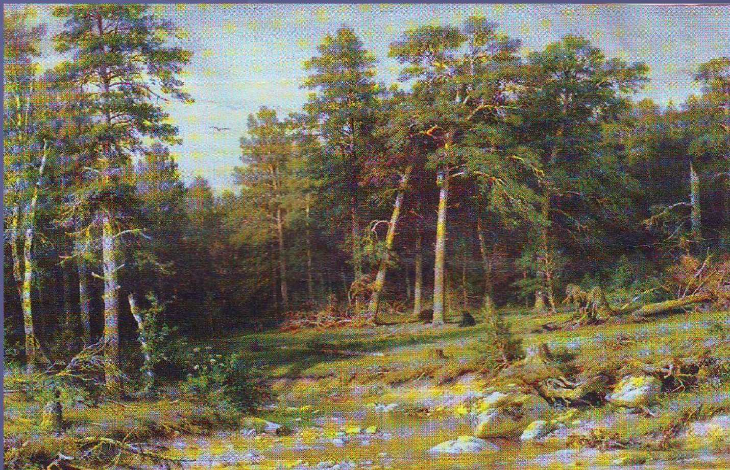
Сосновый бор. Мачтовый лес в Вятской губернии. 1872. Холст, масло. ГТГ.