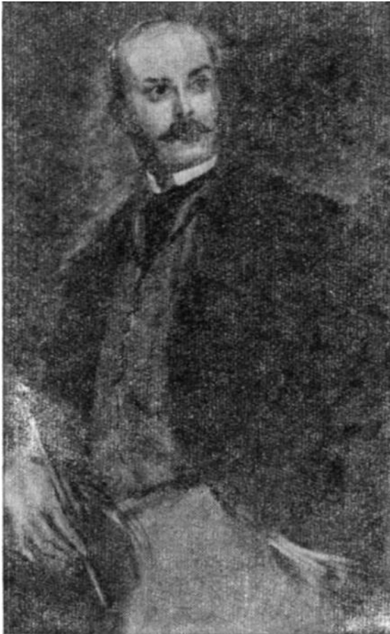
П. Кирсанов. Рисунок К. Рудакова