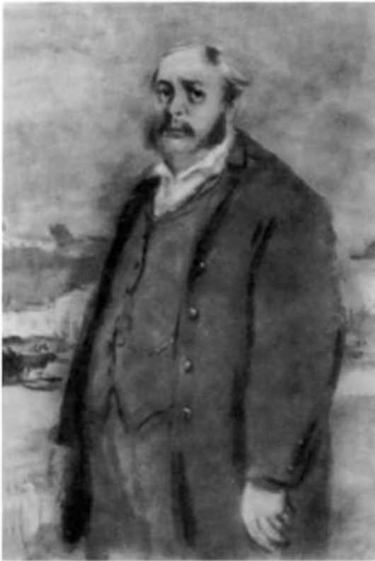
«Отцы и дети». Николай Петрович Кирсанов. Иллюстрация К. И. Рудакова. 1947 г.