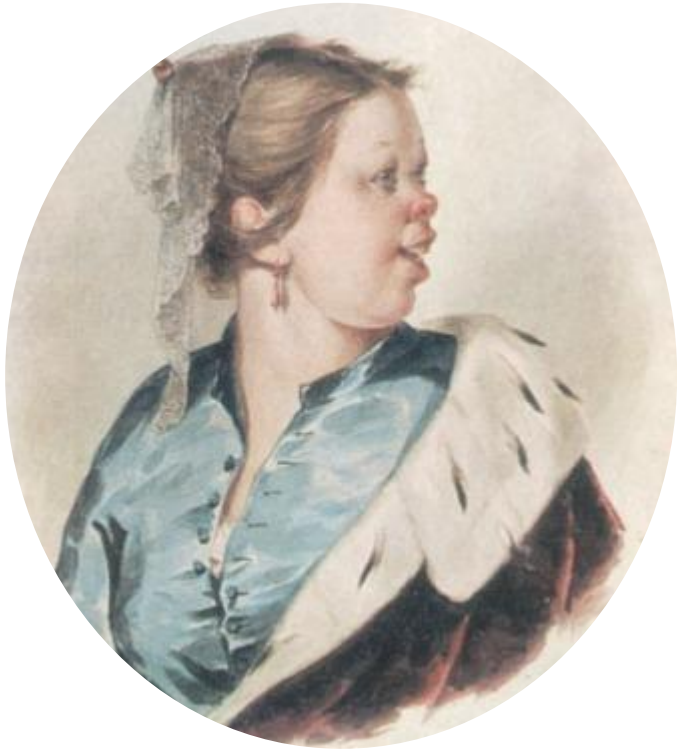
Евдокия Никитишна Кукшина