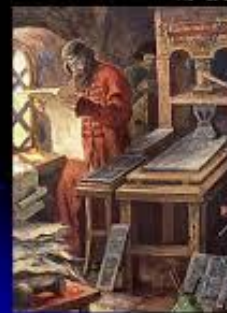
Первая печатная книга «Апостол»

Первую книгу печатали целый год. Это была священная книга «Апостол». Позже Иван Фёдоров напечатал для детей первую славянскую «Азбуку»