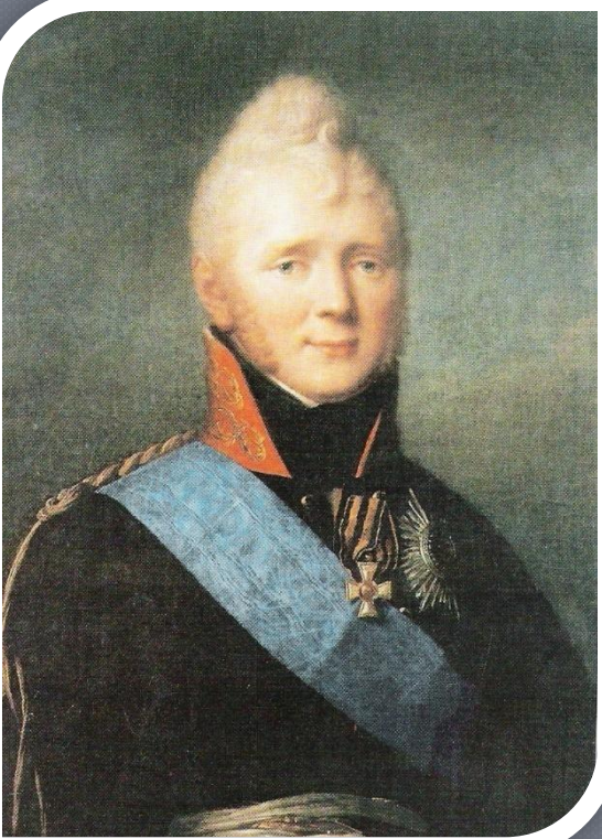
АЛЕКСАНДР I 1777- 1825

Верховным главнокомандующим русской армии был император Александр I.