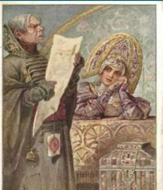
С. Соловьев. Писем