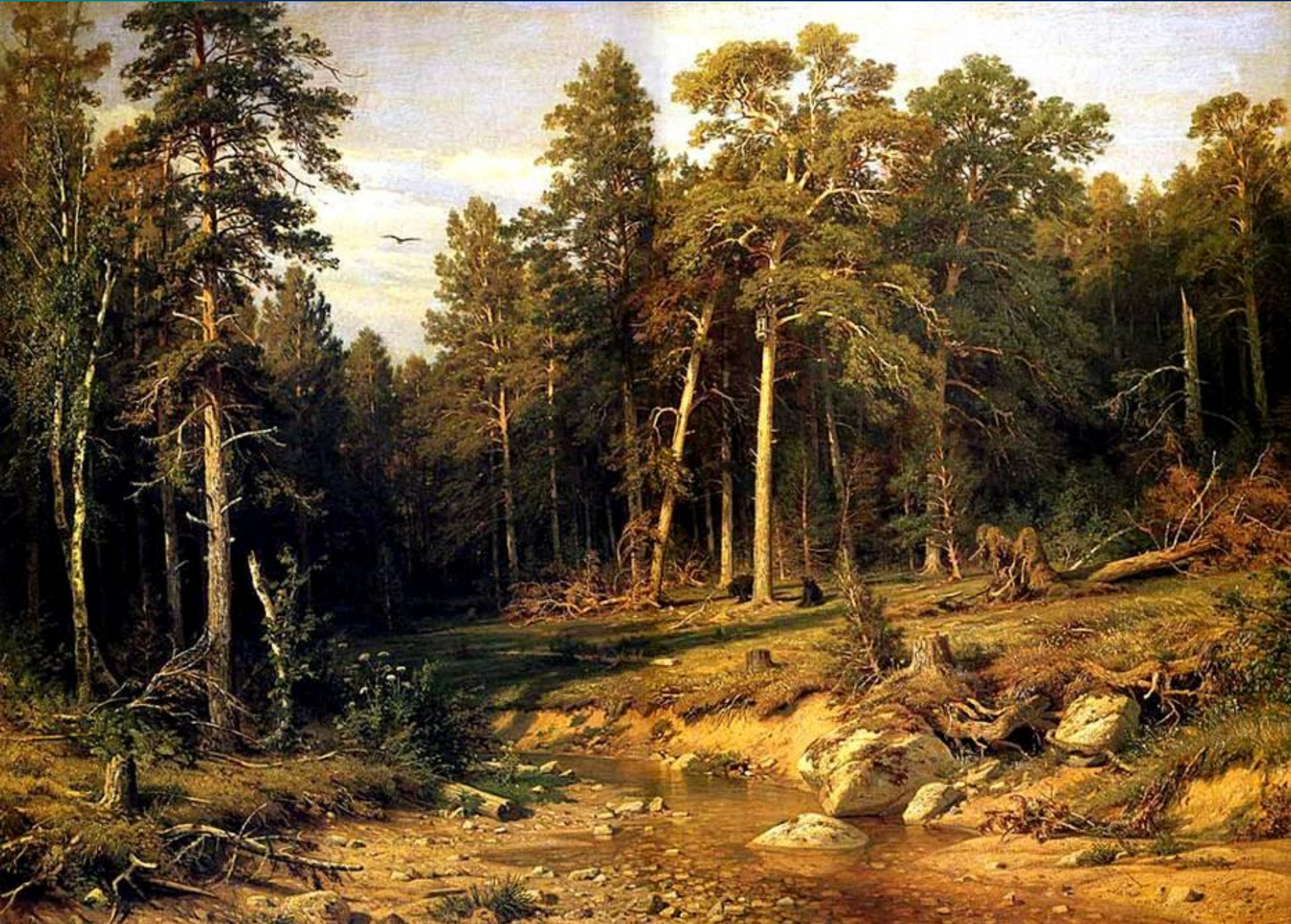
Сосновый бор. Мачтовый лес в вятской губернии