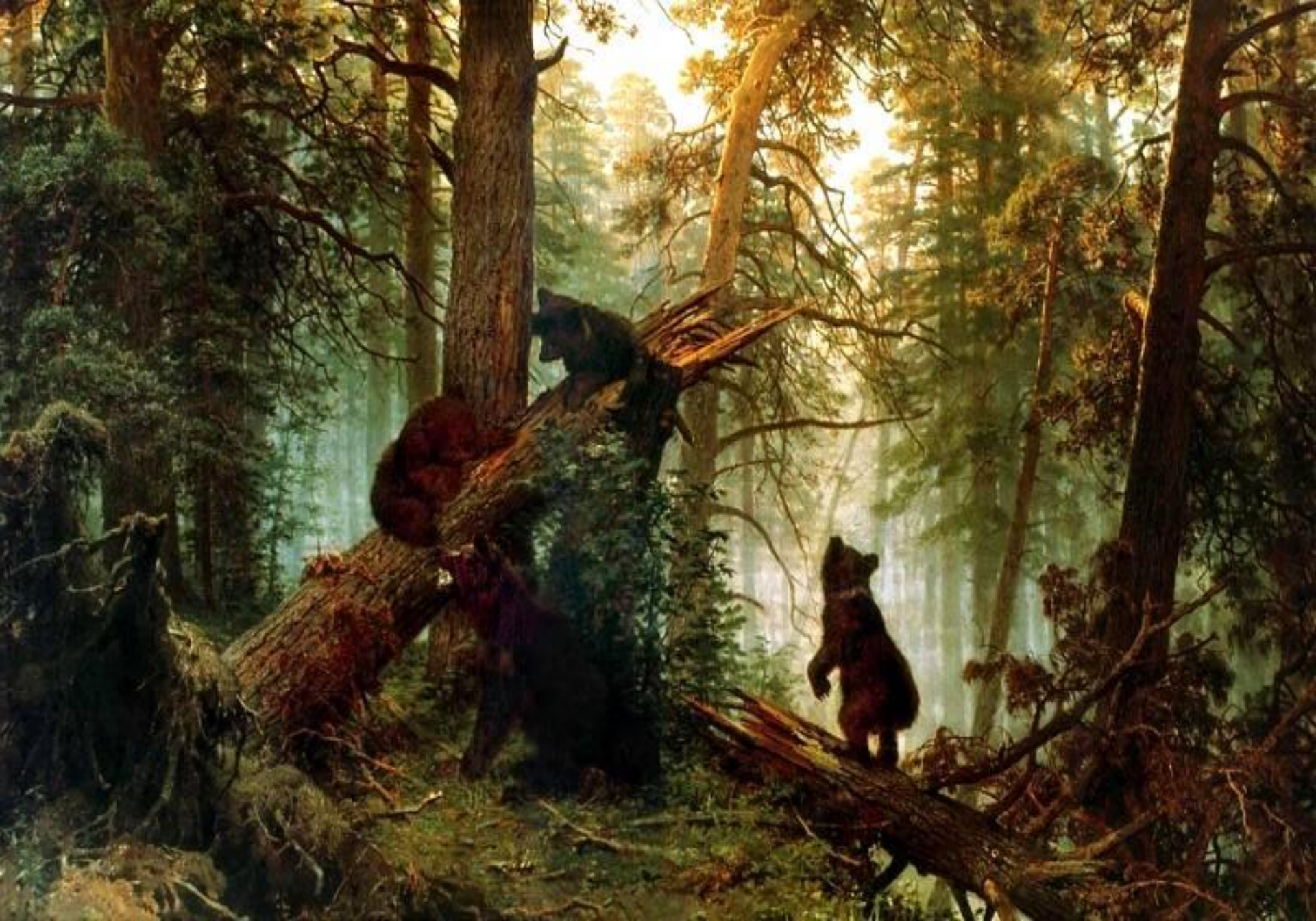
Утро в сосновом лесу