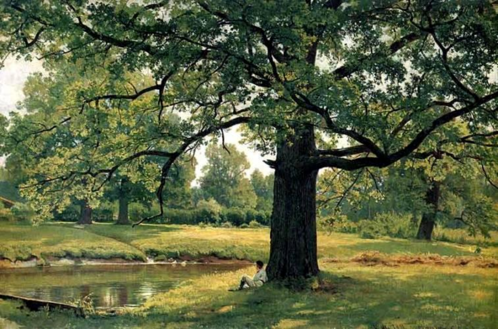
Дубы в старом Петергофе