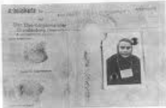
Губная арестованная жи- вотница. Старой Гуси Земельно-базовый, раз- ный фанерный и работы