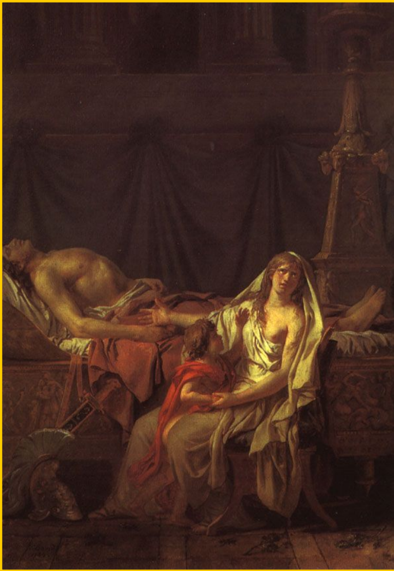
Андромаха у тела Гектора.

На время похорон противники заключили перемирие. Тело Гектора сожгли на большом холме, а его кости уложили в могилу и насыпали высокий холм. «Так погребли они конеборного Гектора»-этими словами поэма заканчивается.