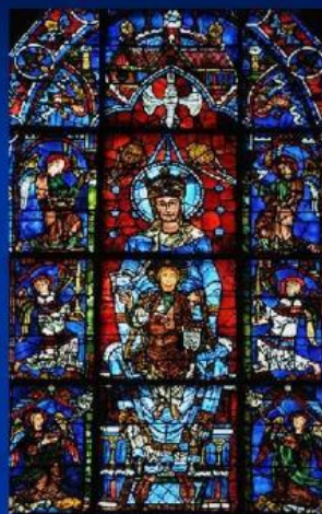
«Богородица», фрагмент изобража