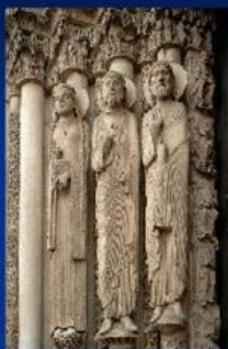
Фрагмент т корольск ого портала