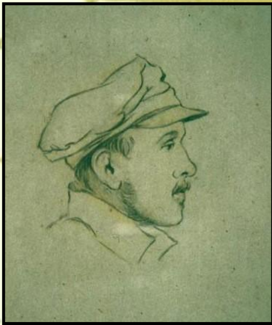
М.Ю. Лермонтов 1814-1841