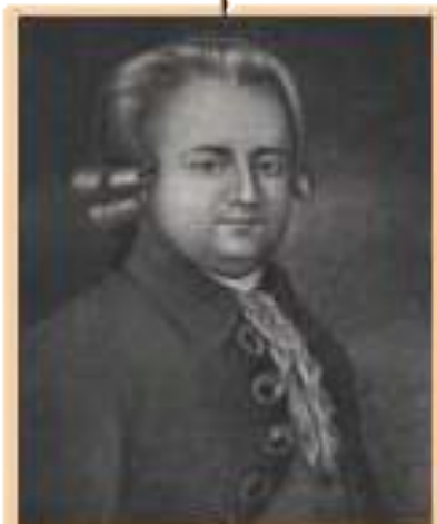
П.Ю.Лермонтов - дед