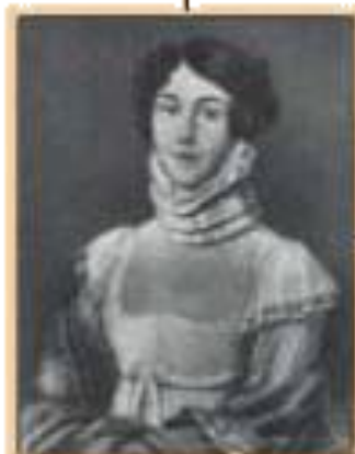
М.М.Лермонтова - мать