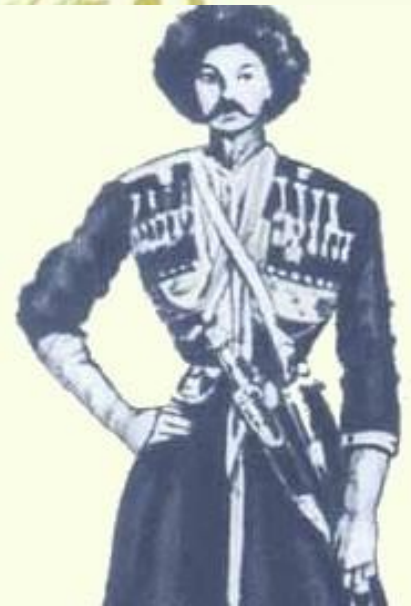
Н.С. Мартынов 1815-1875