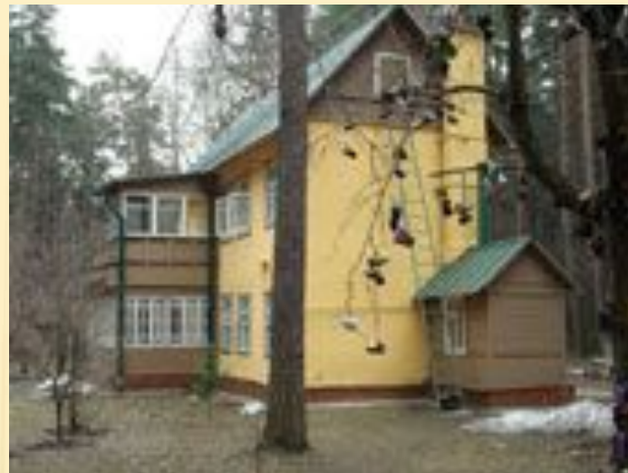
Перedelкино Башмачное дерево у Дома – музея К. И. Чуковского

Корней Чуковский при жизни был самым главным детским кудесником и затеи́ником. Характер великого сказочника передался и его жилищу. Дом-музей Чуковского в Переделкино хранит не только его личные вещи, но и частичку самого писателя. Здесь собрано множество забавных предметов, которые имеют свои чудесные свойства и собственные легенды. Дом-музей Чуковского сохранил свой первозданный облик. Поэтому нетрудно представить себе и самого Чуковского, который жил здесь когда-то, принимал у себя ребятшек со всего Переделкина, общался со знаменитыми писателями. Музей Чуковского в Переделкино до сих пор по-особому относится к каждому ребенку. Для детей предусмотрена специальная экскурсионная программа. Поэтому если среди взрослых посетителей есть хотя бы один ребенок, то вся экскурсия ориентируется именно на него. Музей Чуковского — это мир, созданный специально для детей. Это ещё один приятный подарок детворе от великого сказочника