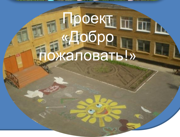
Проект «Добро пожаловать!»