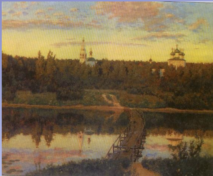
Исаак Левитан. Тихая обитель