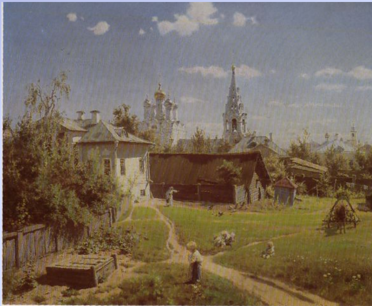
Поленов В.Д. Московский дворик