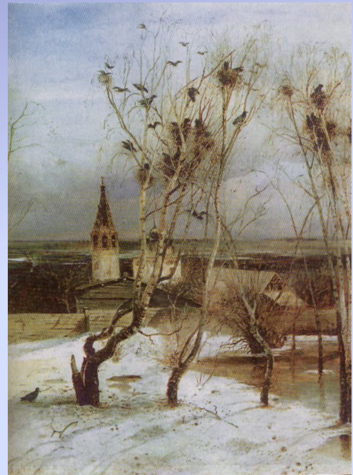
Алексей Саврасов. Грачи прилетели