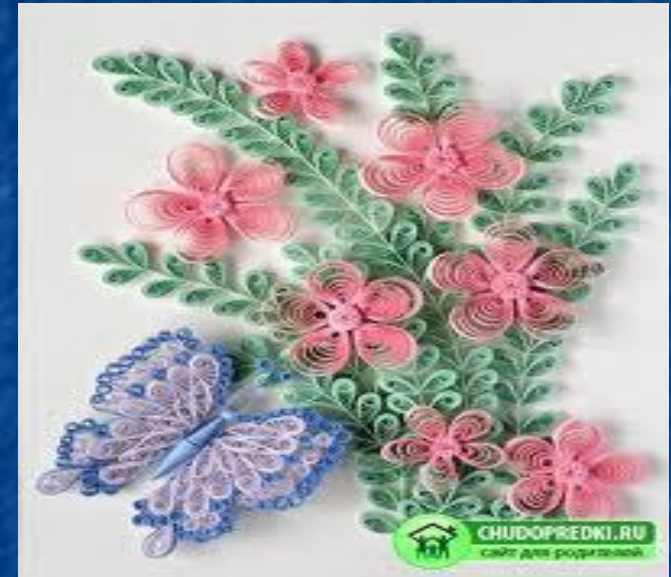
Квиллинг «Праздничный букет»