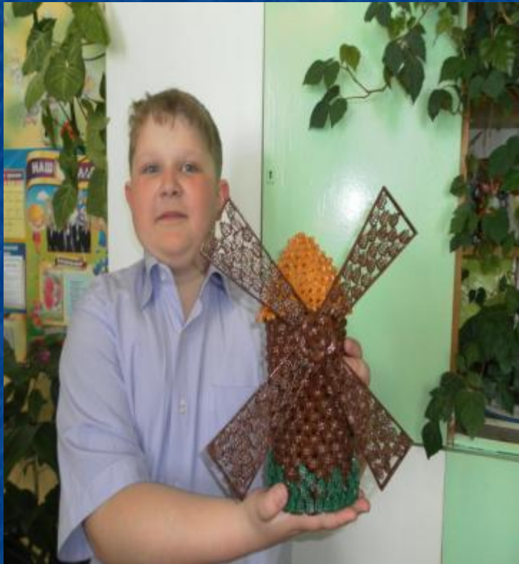
Поделка из макаронных изделий «Мельница»