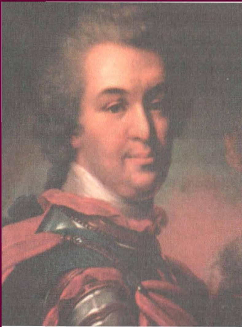
Григорий Александрович Потемкин

В 1773 г. русская армия перешла Дунай. Возобновив военные действия против Турции. Главными силами командовал П. А. Румянцев, другими корпусами – генералы Г.А. Потемкин и А.В. Суворов.