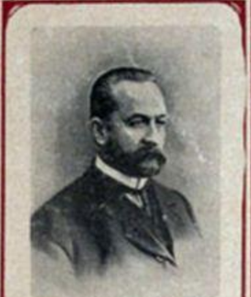
Кн. Г. ЕЛЬВОВЪ, Предсѣдатель Совѣта министровъ, и министръ внутреннихъ дѣлъ.