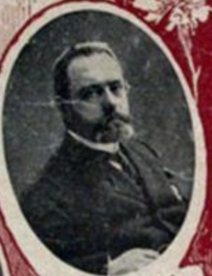
А. И. ГУЧКОВЪ, военный и морской министр.