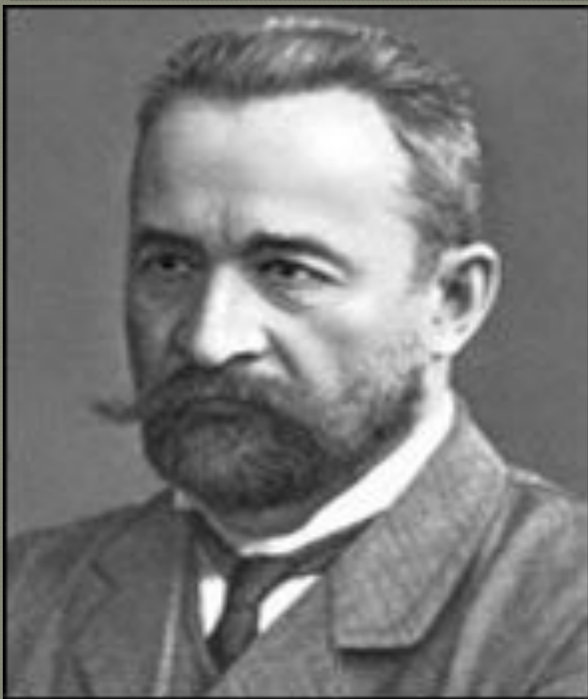
Г.Е.Львов, глава Временного правительства