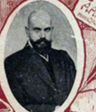
В. Н. ЛЬВОВЪ, оверъ-прокуроръ св. Синода.