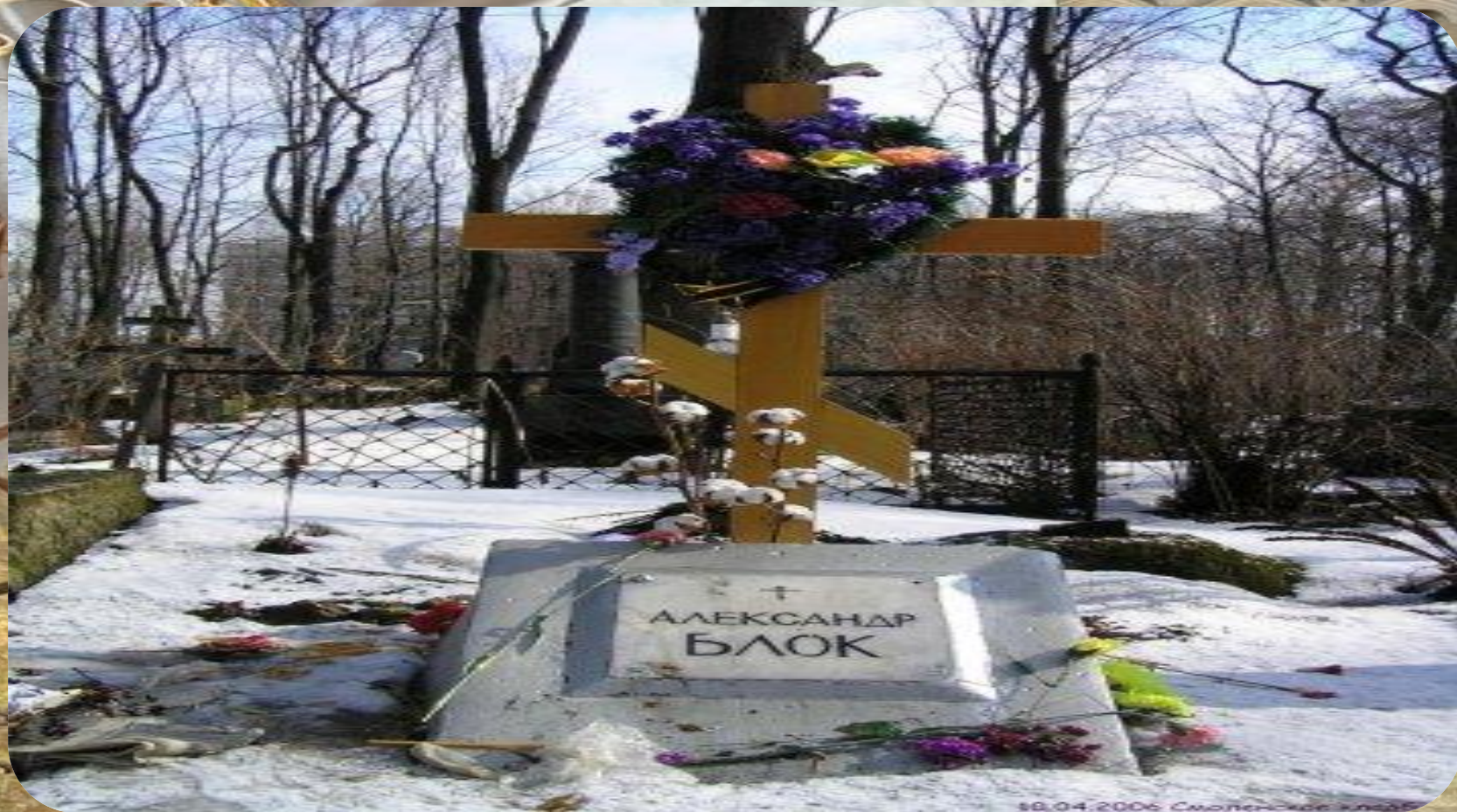
Могила Александра Блока на Смоленском кладбище.