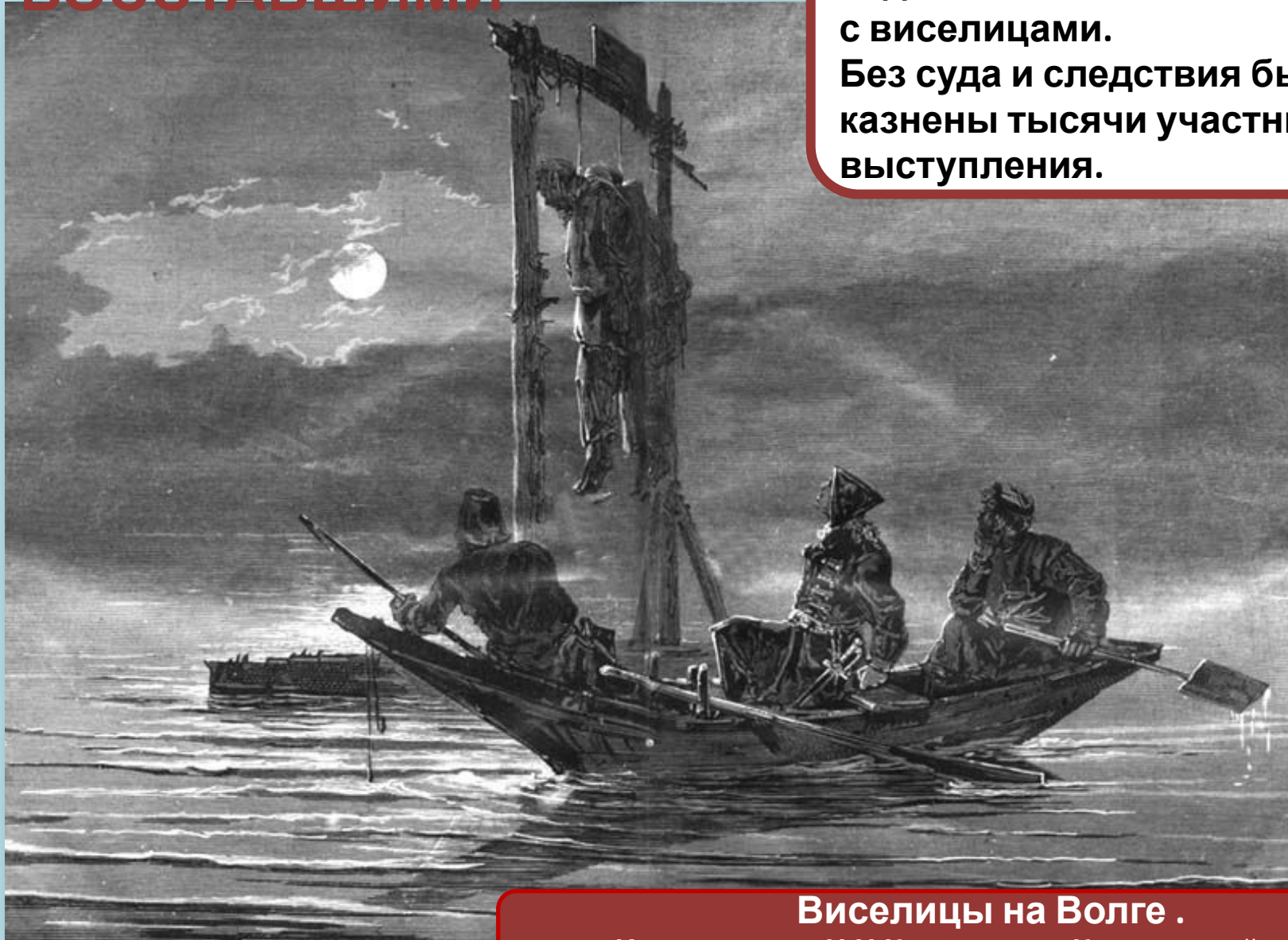
Виселицы на Волге . Иллюстрация Н.Н.Каразина к «Капитанской дочке» А. С. Пушкина.

По Волге в течение нескольких недель плыли плоты с виселицами. Без суда и следствия были казнены тысячи участников выступления.