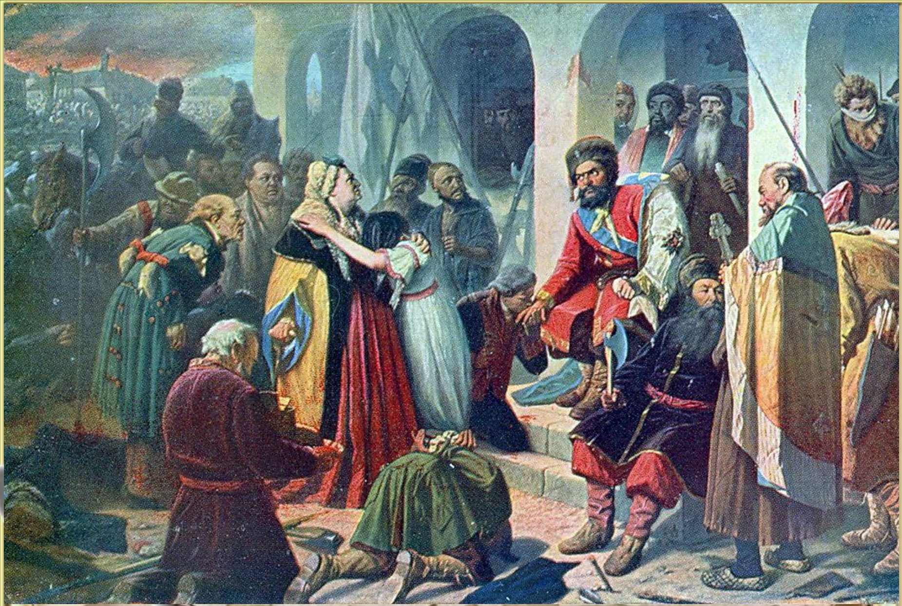
В. В. Перов «Суд Пугачёва»