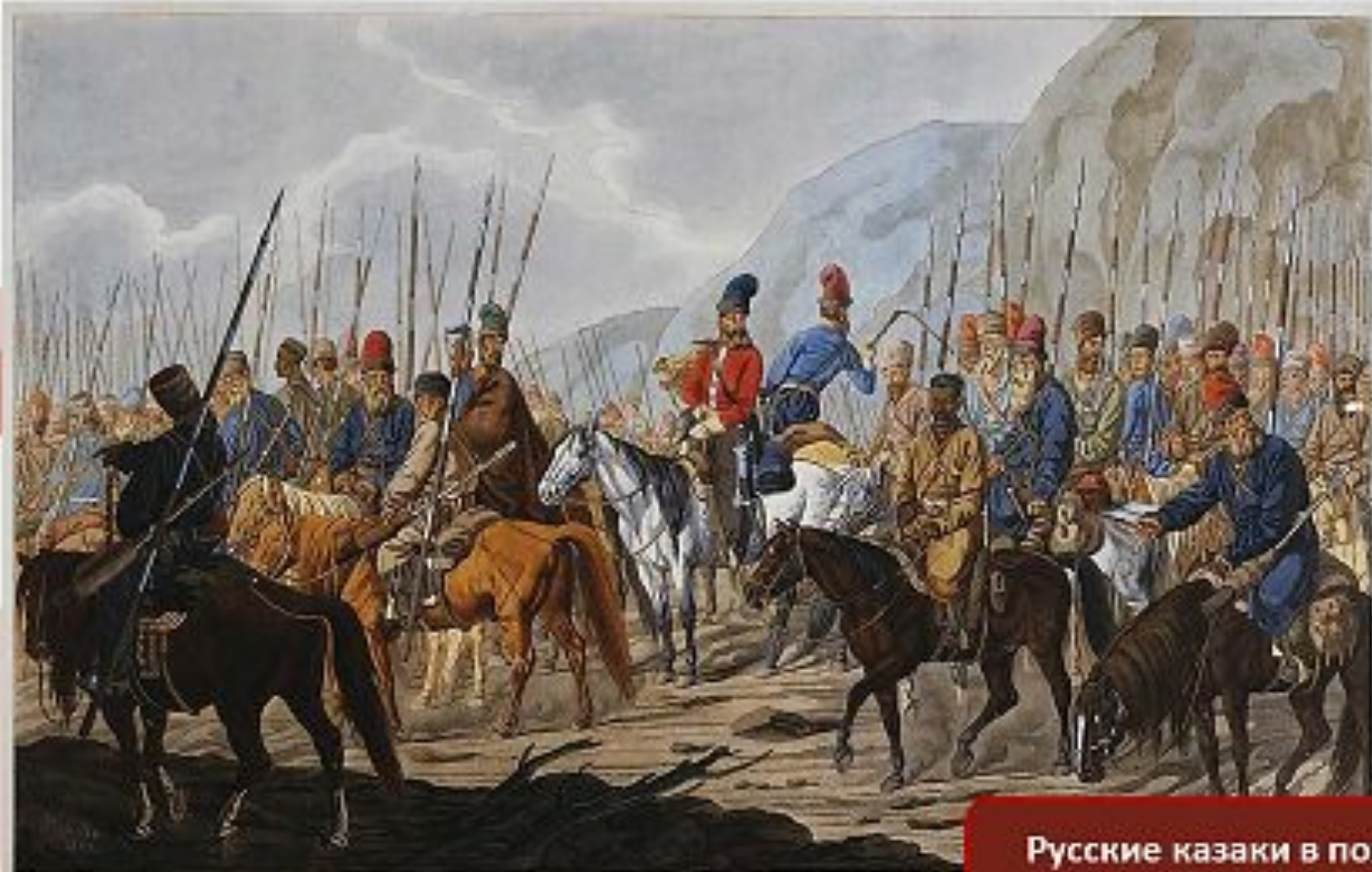
Русские казаки в походе. Художник К.Э.Гесс.

За первые три недели восстания (с 17 сентября по 5 октября 1773 года) она увеличилась с 80 до 30000 человек. Основу ее составляли казаки.