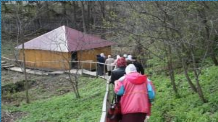
Спуск к пруду и к купальне