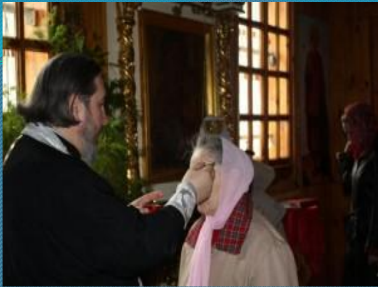
Молебен перед Тихвинской иконой Божией Матери