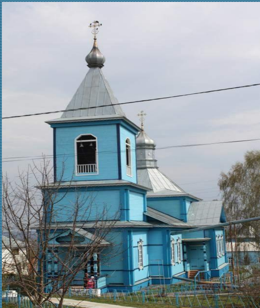
Летний храм с образом Тихвинской иконы Божией Матери

Монастырь назван в честь Тихвинской иконы Божьей Матери. В одном из архивных документов 1900 года летописец пишет: «Главные святые реликвии данной обители и храма: икона Тихвинской Божьей Матери, представляющая из себя копию с подлинной Тихвинской иконы, икона Знамения Богородицы (копия с чудотворной иконы Понетаевского монастыря), крест серебропозлащенный с частями мощей святого апостола Андрея Первозванного, Игнатия Богоносца, священномученных Харлампия, преподобного Феодора Студита и мученика Амоса. Святые мощи хранятся в деревянном ковчеге и в храме открыты во время богослужения. Следует упомянуть еще серебропозлащенный крест и частицы мощей святого Василия Великого, Григория Богослова, Иоанна Златоустного и святителя Николая Марликийского чудотворца. Сей крест висит на Тихвинской иконе Божьей Матери. Упомянем также и об иконе святого мученика Пантелеймона и Харлампия.