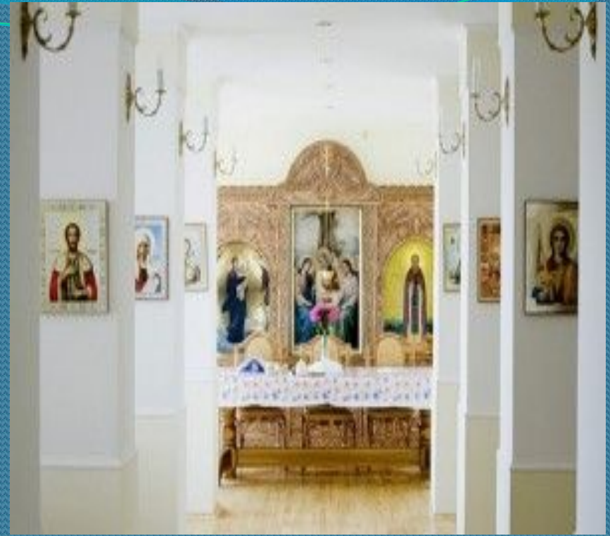
Внутреннее обустройство монастыря