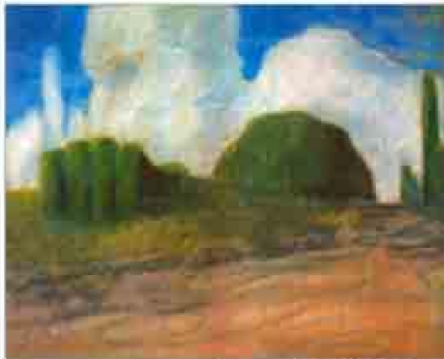
Микалоюс ЧЮРЛЁНИС. День