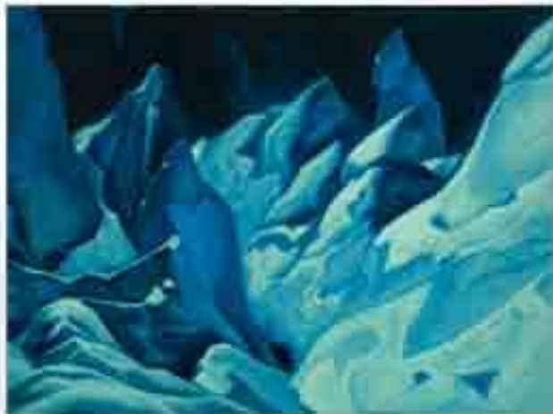
Николай РЕРИХ. Стражи ночи

Можно ли сказать, исследователь, что поэтам свойственно оживлять и очеловечивать образы природы и природных явлений?