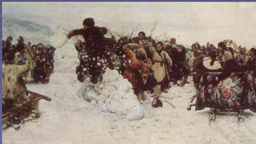
В.Суриков «Взятие снежного городка»