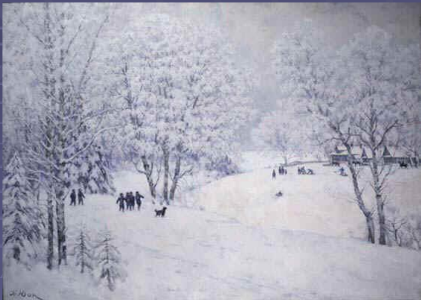
К.Юон «Русская зима»