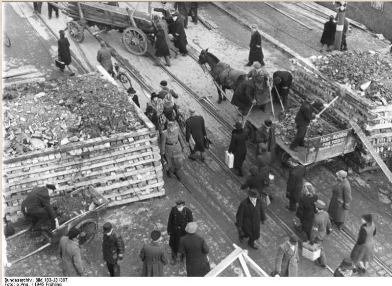
Bild 183-J1387 1945 Frühling