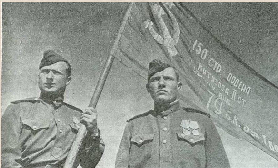
Разведчики 756-го полка 150-й стрелковой дивизии М. А. Егоров (справа) и А. Б. Кантария со Знаменем Победы. Берлин. Май 1945.