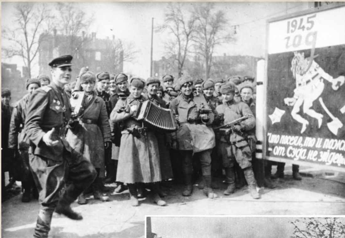
Mai 1945 Anfang