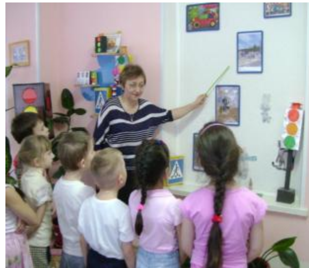
"На улицах большого города"