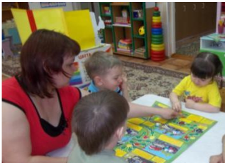
"День юного пешехода".