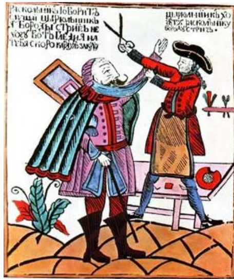
Насильственное бритье бород. Лубок XVIII века.