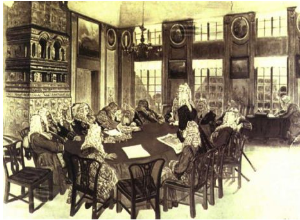
Заседание Сената при Петре I.

Полностью преобразованы органы государственного управления: учрежден Сенат, вместо приказов введены коллегии.