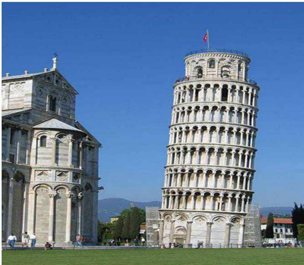
Пизанский собор. Италия. XI-XII вв.

(Отклонение от вертикальной линии на 4,5 м.)